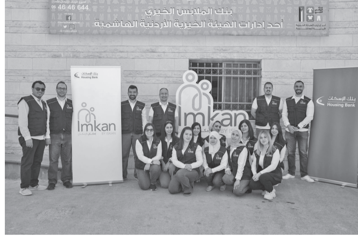
الإسكان المتواصلة ضمن برنامج «إمكان الإسكان» للمسؤولية الاجتماعية ضمن

قطاع التمكين الاجتماعي، الذي يُركز في إطاره على إيصال الدعم المباشر للمستفيدين وتعزيز دور منظمات المجتمع المدني. وقد شارك متطوعو برنامج «إمكان الإسكان» من موظفي البنك في تنفيذ الفعالية التي تعكس قيم العطاء والمشاركة الإنسانية، والتي تبرز أهمية العمل التطوعي الذي يعد أحد الركائز الأساسية للبرنامج. ومن الجدير بالذكر، بأن بنك الملابس الخيري الذي بدأ عمله في عام ٢٠١٣، يسعى لتوفير الملابس الملائمة للأسر الأردنية العفيفة على مدار العام من خلال صالتيه عرض في العاصمة والكرك ومن خلال الصالات المتتقة.