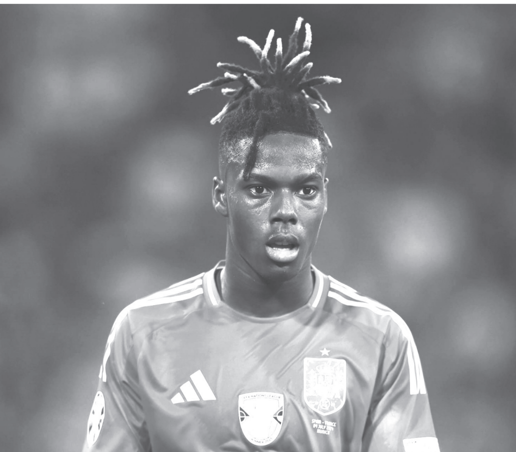
نبض البلد - وكالات

مستقبله، مع ورود تقارير عن اهتمام أندية أوروبية كبرى بخدماته.