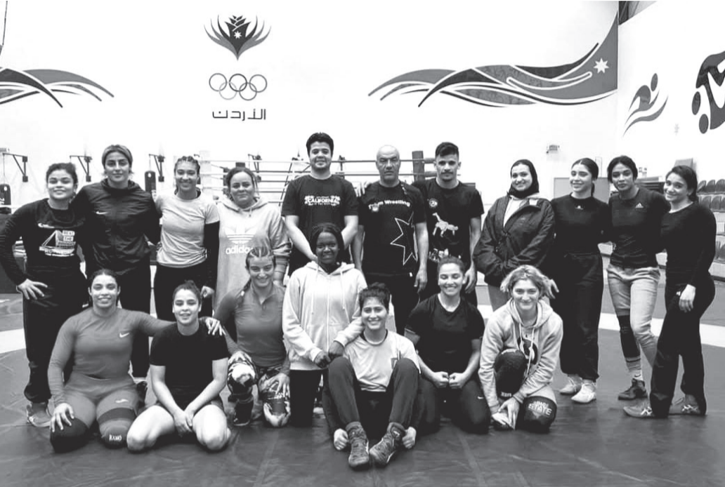
نبض البلد - عمّان

زال مستمراً حتى الآن، لافتاً إلى أن منتخب مصر غادر أمس السبت، في حين سيبقى المعسكر التدريبي قائماً مع المنتخب المغربي حتى موعد انطلاق البطولة. وتتواصل في فندق "كروب" دورة تكنولوجيا المعلومات، التي ستختتم فعاليات الاثنين، بمشاركة 24 دارساً، من بينهم 11 أردنياً. وتشمل الدورة التدريب على نظام حكم الفيديو المساعد (فار)، الذي سيطبق لأول مرة في هذه البطولة، بهدف حصر المراجعة السريعة للحالات المشكوك فيها، وتقديم المشورة للحكم في حسم المواقف المثيرة للجدل. كما تتضمن الدورة اختبارات نظرية وأخرى عملية على تنفيذ برامج متطورة وحديثة على أجهزة الحاسوب، سيتم العمل بها اعتباراً من هذه النسخة الجديدة للبطولة، على أن تُطبق لاحقاً في المسابقات المعتمدة من الاتحاد الدولي للمصارعة.