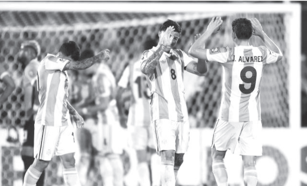
نبض البلد - وكالات

كان قلة الخطورة، وهو ما كان جلياً. اللحظات التي سيطرنا فيها لم تتمكن من ترجمة السيطرة إلى مواقف خطيرة، أما الأمر الإيجابي، فكان القدرة على اللعب نداءً في نصف الساعة الأولى، لم تتمكن من بناء لعب هجومي في أغلبية الشوط الثاني،.