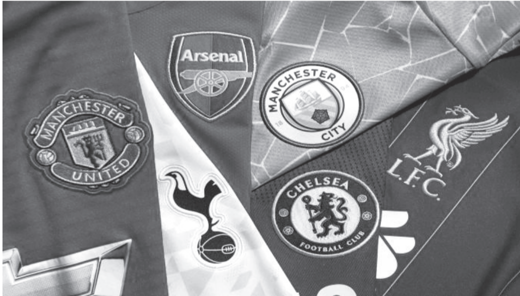
نبض البلد – وكالات

منح تحقيق فريق نيوكاسل يونايتد لقب بطولة كأس الرابطة الإنكليزية، بعد فوزه على غريمه ليبربول بهدفين مقابل هدف، الأحد الماضي، الأمل الكبير لأندية البريميرليغ في حجز ١١ مقعداً من أجل المنافسة في جميع البطولات الأوروبية خلال الموسم المقبل.