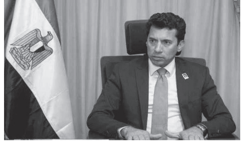
نبض البلد – وكالات

دخل وزير الرياضة المصري أشرف صبحي في مرمى نيران جماهير النادي الأهلي بعد تصريحاته أن القلعة الحمراء تتحمل مسؤولية خسائر مباراة القمة ١٣٠ وقال وزير الشباب والرياضة في تصريحات إذاعية، إن النادي الأهلي هو صاحب قرار الانسحاب من مباراة القمة ١٣٠ أمام نادي الزمالك ويجب عليه أن يتحمل تبعات قرار انسحابه.