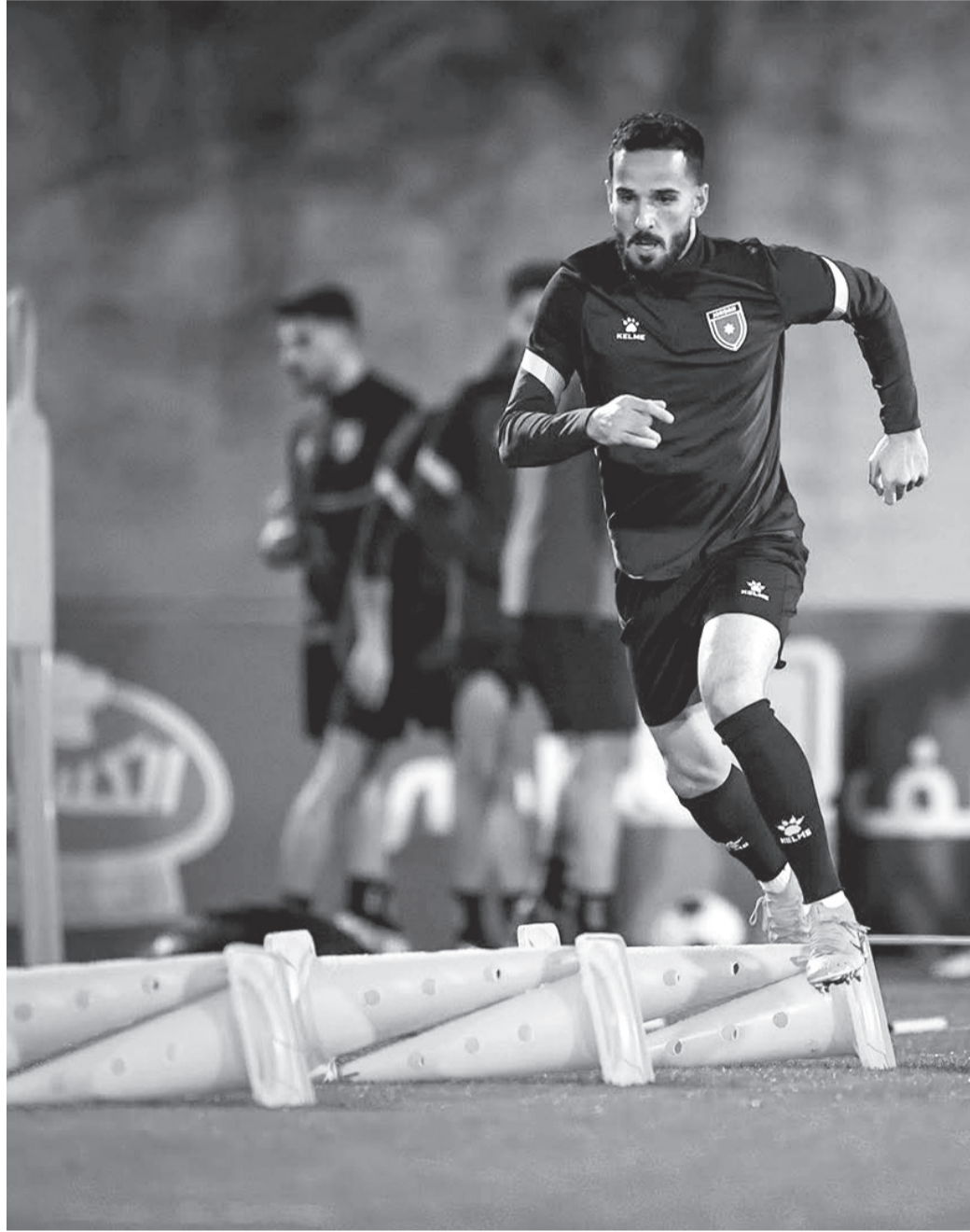
نبض البلد – عمان

– السلامي: لقاء المنتخب الفلسطيني أهم من الكوري – أبو جزر: منتخب فلسطين معتاد على اللعب خارج ملعبه