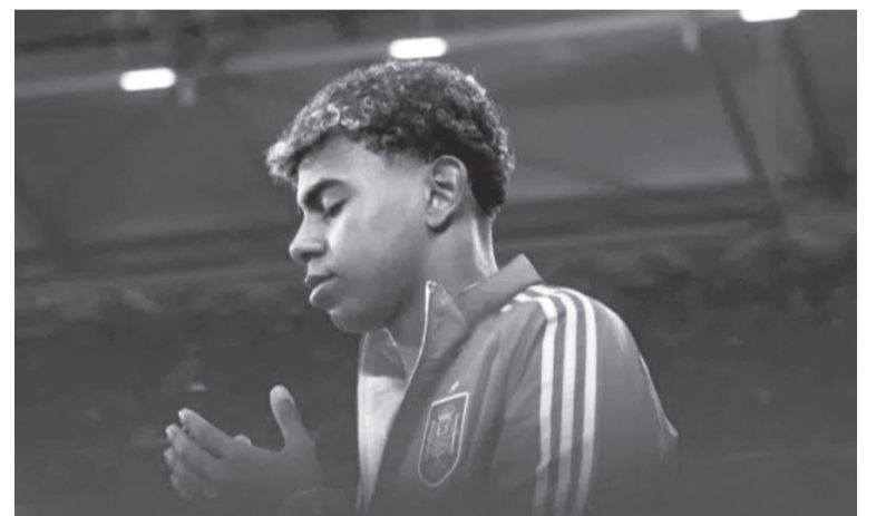
نبض البلد – وكالات

كشف النجم الشاب لامين جمال لاعب برشلونة والمنتخب الإسباني عن تفاصيل يومه خلال شهر رمضان حيث يوازن بين التزاماته الدينية، ومتطلبات التدريبات القوية مع فريقه ومنتخب بلاده يأتي ذلك في ظل استعداد المنتخب الإسباني، بطل يورو ٢٠٢٤، لمواجهة هولندا في ربع نهائي دوري الأمم الأوروبية يومي الخميس والأحد المقبلين.