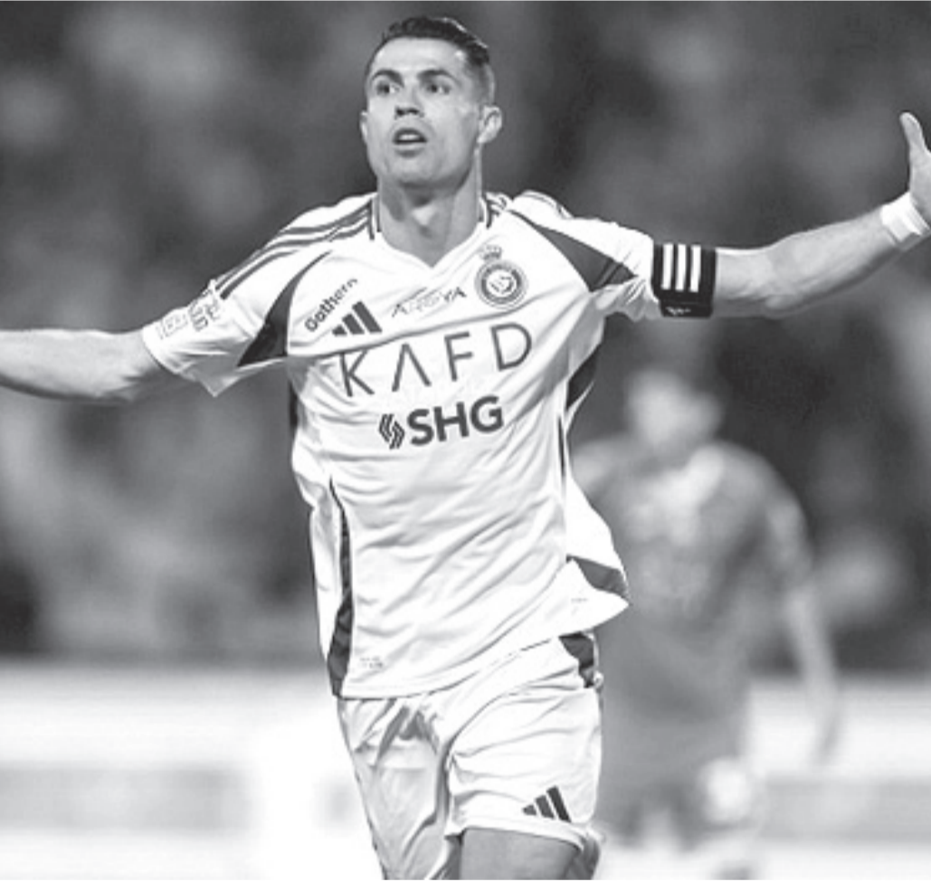
نبض البلد - وكالات

يواصل أسطورة كرة القدم، كريستيانو رونالدو، تحديه للتمر بتسجيله الهدف رقم ٩٢٧ في مسيرته الكروية الحافلة، وذلك خلال فوز فريقه النصر السعودي ٣ - صفر على ضيفه استقلال طهران الإيراني، مساء الاثنين، ببطولة دوري أبطال آسيا للنخبة.