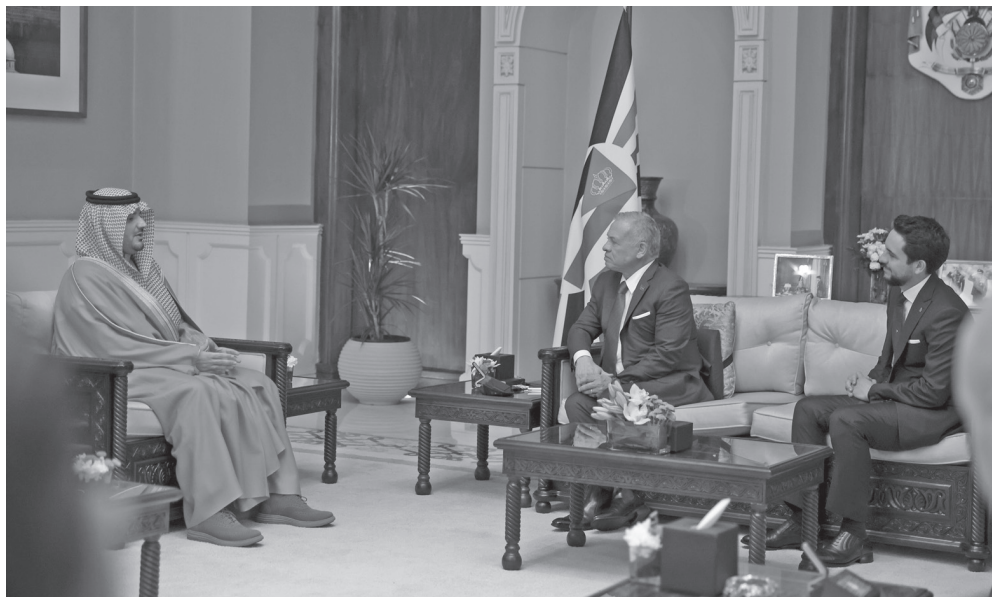
القطاع دون تهجير سكانه، وتعزيز تدفق المساعدات الإغاثية. وحضر اللقاء مدير مكتب جلالة الملك المهندس علاء المرافق.

استقبل جلالة الملك عبدالله الثاني في قصر بسمان الزاهر، أمس الأربعاء، وزير الداخلية في المملكة العربية السعودية، سمو الأمير عبدالعزيز بن سعود بن نايف بن عبدالعزيز، بحضور سمو الأمير الحسين بن عبدالله الثاني ولي العهد. ونقل سموه لجلالة الملك تحيات أخيه خادم الحرمين الشريفين الملك سلمان بن عبدالعزيز آل سعود، ملك المملكة العربية السعودية الشقيقة، وأخيه سمو الأمير محمد بن سلمان بن عبدالعزيز آل سعود، ولي العهد، رئيس مجلس الوزراء.