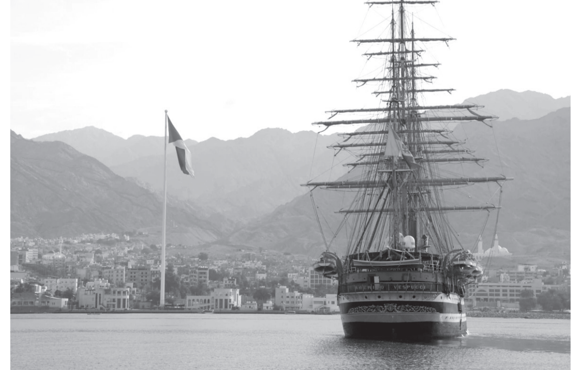
نبض البلد - العقبة

وهي سفينة تدريب تابعة للقوة البحرية الإيطالية، وأطلقت عام 1931 وتتميز بتصميمها الكلاسيكي الذي يحاكي سفن القرون الوسطى مع هيكل فولاذي وشرعة خشبية، كما تمثل أنما تمثل رمزاً للتراث البحري الإيطالي في المحافل الدولية. وعزفت موسيقات القوات المسلحة الأردنية معزوفات وطنية أثناء رسو السفينة. وستوقف السفينة الشراعية في ميناء العقبة السياحي حتى يوم السبت المقبل، وسيتم إتاحة يوم الجمعة أمام المواطنين لزيارة السفينة بشكل مجاني، من خلال الدخول إلى رابط التسجيل للراغبين بزيارتها ( https://tourvespucci.it/en/come-aboard ). وتأتي زيارة السفينة إلى العقبة تلبية لدعوة قائد القوة البحرية والزوارق الملكية لزيارة مدينة العقبة ضمن جولتها حول العالم التي بدأت عام 2023، من قائد القوات البحرية الإيطالية أثناء لقاءه في أحد المحافل الدولية. يشار إلى ان الميناء السياحي يستقبل سفن سياحية من كافة أرجاء العالم، لما تتمتع به العقبة من مناخ معتدل طوال العام، وهي تعد وجهة سياحية ومقصدًا مثاليًا للسياح من حول العالم، لكا تتميز به شواطئها الرائعة والياه الصافية التي تعد من أفضل المواقع للفوس والرياضات البحرية، إلى جانب ذلك، تقدم العقبة للزوار تجربة ثقافية غنية وأجواء متنوعة التي تجمع بين الحداثة والتقاليد.