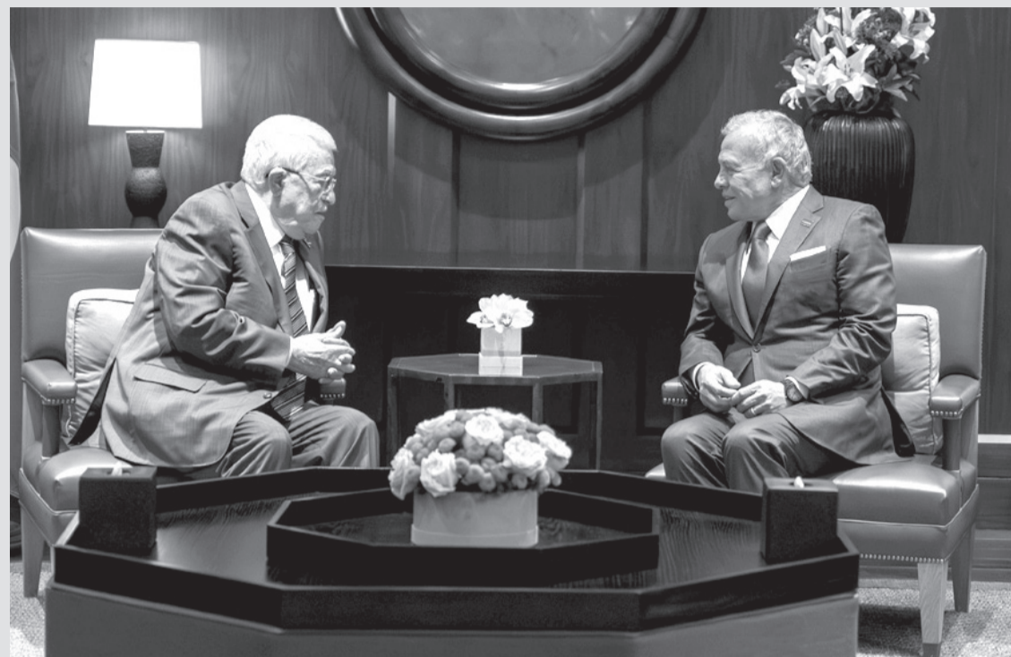
نبض البلد - عمان

أكد جلالته الملك عبدالله الثاني لدى استقباله الرئيس الفلسطيني محمود عباس في قصر الحسينية، أمس