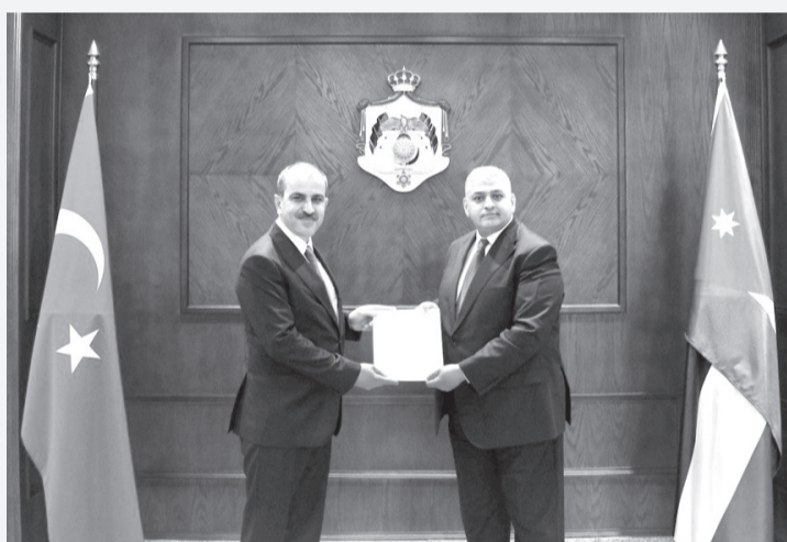
نبض البلد - عمان

الأربعاء، نسخة من أوراق اعتماد سفير الجمهورية التركية الشقيقة، يعقوب جايماز أوغلو، سفيراً معتمداً ومقيماً لدى المملكة.