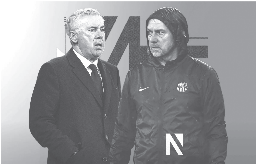
نبض البلد – وكالات

الخيارات الدفاعية بسبب الإصابات المتكررة لمُدافعيه الأساسيين وينتظر ريال مدريد فترة حاسمة، إذ سيخوض منافسات الملحق المؤهل لدور الـ16 لدوري أبطال أوروبا ضد بطل البريميرليج مانشستر سيتي في مواجهة نارية، وسيسبق تلك المباراتين، مواجهة حاسمة ضد ليدانيس بكأس الملك، ولقاء حاسم ضد أتلتيكو مدريد في الليجا ولا بديل عن الفوز للميرنجل لحفاظ على فرصه في البطولات الثلاث، والتي يأمل في التتويج بها جميعاً. أما برشلونة فيسعى لاستعادة صدارة الليجا من جديد، بعدما قلص الفارق إلى 4 نقاط مع الغريم التقليدي والمتصدر ريال مدريد كما أن الفريق الكتالوني، سيخوض مواجهة ليست سهلة ضد فالنسيا في ربع نهائي كأس ملك إسبانيا، حيث سيسعى الخفافيض لتعويض الهزيمة الثقيلة بسباعية ضد البارسا في الليجا. وسينتظر برشلونة، لمعرفة منافسه في دور الـ16 لدوري الأبطال، بعد نهاية مواجهات الملحق ختاماً، قرار عدم إبرام صفقات مدفوعاً بأسباب مالية وإستراتيجية، إلا أنه يضع ريال مدريد وبرشلونة أمام اختبار حقيقي لقدرة تشكيلتهما الحالية على الصمود والتألق في ظل التحديات المتزايدة خلال ما تبقى من الموسم.