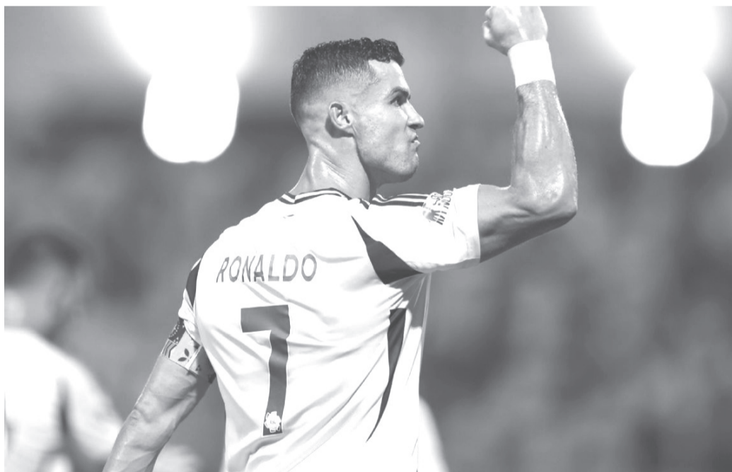
نبض البلد – وكالات

والتلفزيون كانوا يتحدثون عن المباراة، مدريد وبرشلونة، كريستيانو وميسي، بيكيه وراموس، كان الأمر رائعاً، والمنافسة كانت صحية..