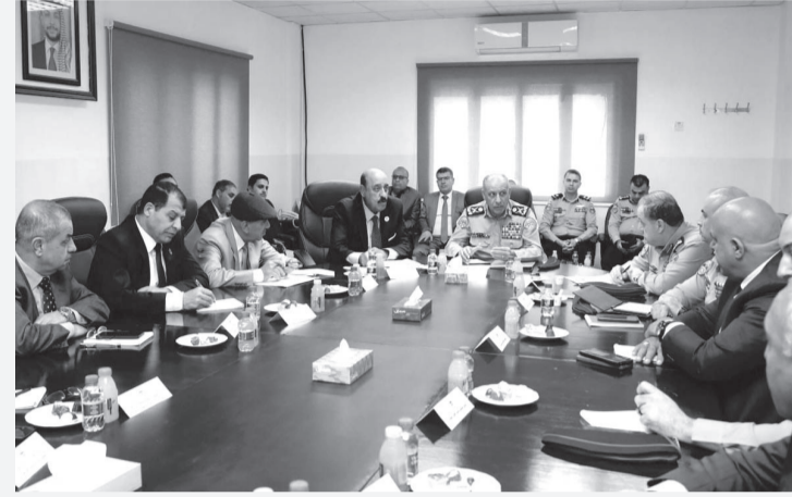
نبض البلد - عمان

من جانبه أشنى مدير عام المؤسسة على جهود مديرية الأمن العام وتعاونها المستمر مع المؤسسة بما يخدم رفقاء السلاح من المتقاعدين العسكريين وتوفير الظروف المناسبة لهم بما يلبي احتياجاتهم والعمل على تحسينها وإيجاد فرص عمل لهم في السوق المحلي.