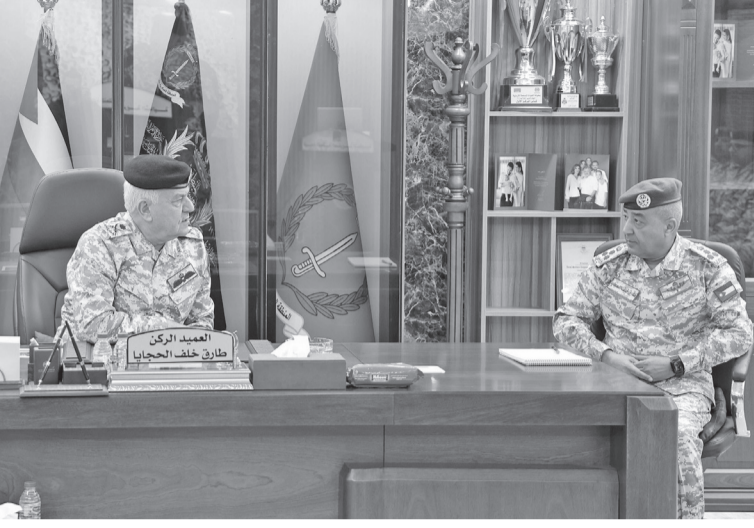
نبض البلد - عمان

زار رئيس هيئة الأركان المشتركة اللواء الركن يوسف أحمد الحنيطي، الاثنين، قيادة المنطقة العسكرية الشمالية، وكان في استقباله قائدها. واستمع اللواء الركن الحنيطي إلى إيجاز قدمه قائد المنطقة عن المهام والواجبات والبرامج التي تنفذها المنطقة وسير الأمور العملياتية والتدريبية واللوجستية، والجهود المبذولة في حماية الحدود ضمن منطقة مسؤوليتها، فضلاً عن جاهزية تشكيلات ووحدات المنطقة في تنفيذ أي واجب يناط بها.