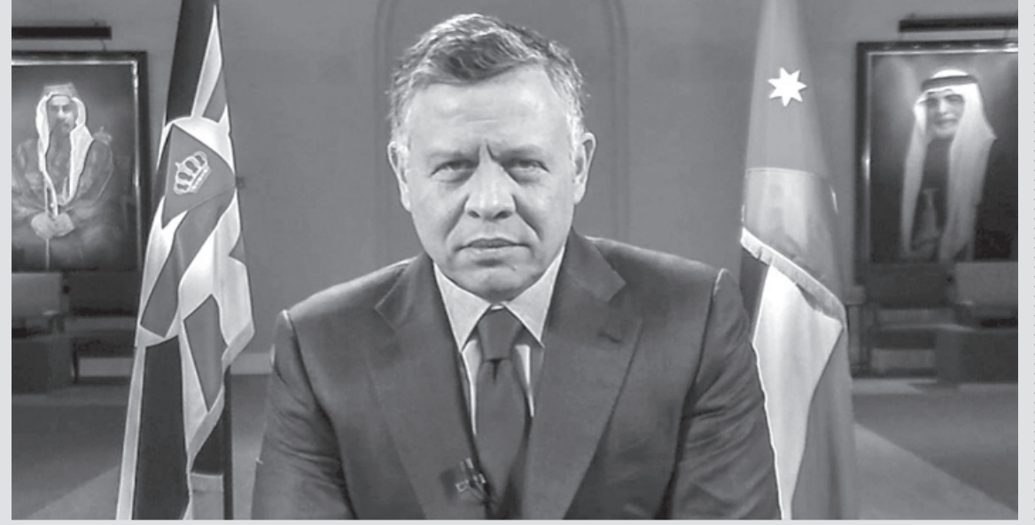
نبض البلد - عمان

بحث جلالة الملك عبدالله الثاني خلال اتصال هاتفي مع وزير الخارجية الأميركي ماركو روبيو، الاثنين، أبرز المستجدات في المنطقة، وسبل تعزيز الأمن والاستقرار فيها. وتناول الاتصال آليات تعزيز الشراكة الاستراتيجية بين الأردن والولايات المتحدة، والحرص على ادامة التنسيق والتشاور تجاه مختلف القضايا.