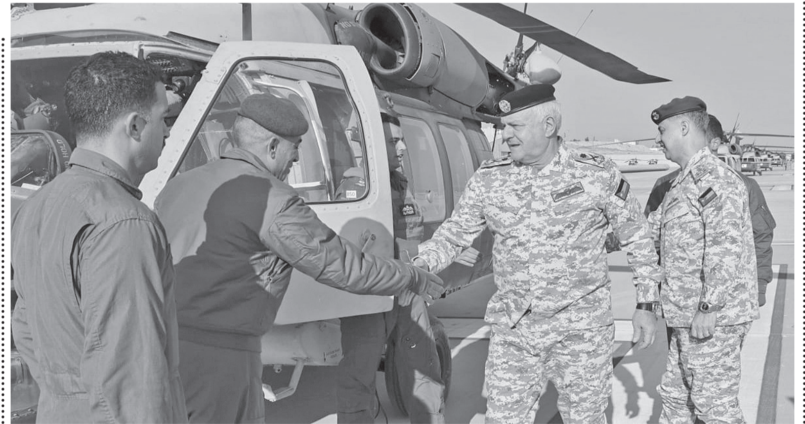
نبض البلد - عمان

تفقد رئيس هيئة الأركان المشتركة، اللواء الركن يوسف أحمد الحنيطي، أمس الثلاثاء، قاعدة الملك عبدالله الثاني الجوية، حيث كان في استقباله قائد سلاح الجو الملكي وقائد القاعدة.