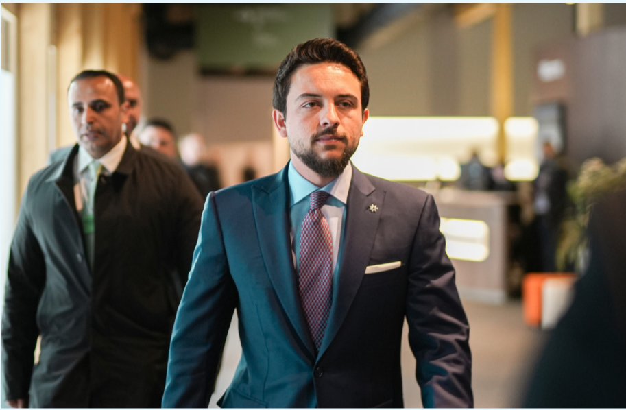
نبض البلد - دافوس

مندوبا عن جلالة الملك عبدالله الثاني، شارك سمو الأمير الحسين بن عبدالله الثاني ولي العهد، أمس الأربعاء، بأعمال المنتدى الاقتصادي العالمي في دورته الخامسة والخمسين، المنعقد في مدينة دافوس السويسرية. ويعقد المنتدى تحت شعار "التعاون من أجل العصر الذكي"، بمشاركة قادة دول ورؤساء تنفيذيين لشركات عالمية ورواد أعمال. ويركز المنتدى على مفاهيم إعادة بناء الثقة وإعادة تصور النمو، والاستثمار في الأفراد وحماية الكوكب والصناعات في العصر الذكي، وإدارة التحول العادل والشامل في قطاع الطاقة، والتحديات الإقليمية والعالمية المشتركة.