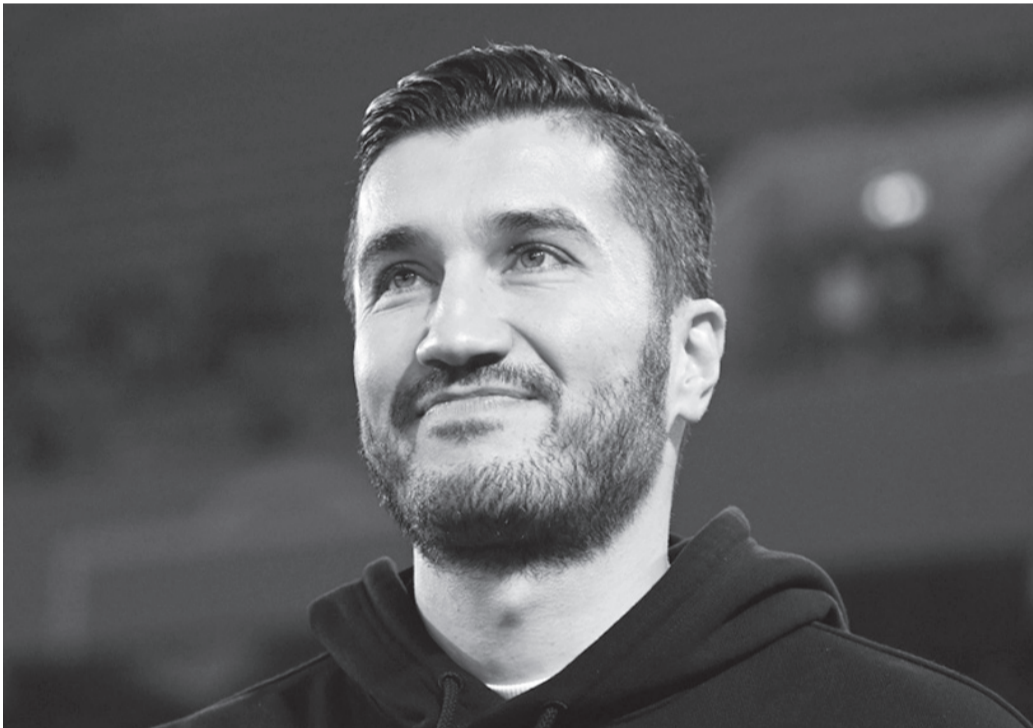
نبض البلد - وكالات

أعلن نادي بوروسيا دورتموند الألماني إقالة مدربه، ثوري شاهين، بعد حوالي سبعة أشهر من قيادته النادي الألماني إلى المباراة النهائية لبطولة دوري أبطال أوروبا، عندما واجه نادي ريال مدريد الإسباني وخسر المواجهة بهدفين نظيفين. وأكد نادي بوروسيا دورتموند الألماني في بيان رسمي، الأربعاء، إقالة مدربه ثوري شاهين، من منصبه رسمياً، وذلك إثر تعرض النادي لأربع خسارات متتالية، آخرها أمام بولونيا الإيطالي في الجولة السابعة من مرحلة الدوري لمنافسات دوري أبطال أوروبا لكرة القدم 2024-2025، وسيقت ذلك خسارة النادي في بطولة الدوري الألماني أمام باير ليفركوزن ثم هولستين كيل واينتراخت فرانكفورت.