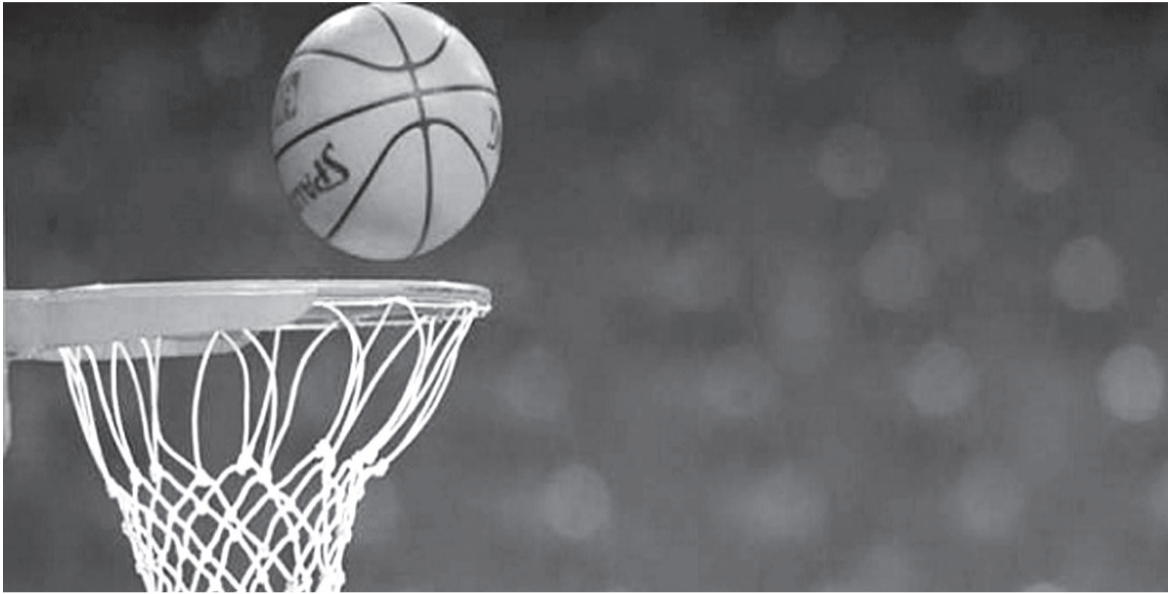
الانباط - عمان

تجري اليوم الخميس مبارياتان في صالة الأمير حمزة بمدينة الحسين للشباب، في إطار منافسات الجولة الثالثة عشرة من دوري CFI الممتاز لكرة السلة. ويلتقي فريق الأهلي نظيره الجليل عند السادسة مساء، فيما يلتقي الأشرفية نظيره الأرثوذكسي عند الثامنة مساء. وينفرد اتحاد عمان بصدارة جدول الترتيب محققاً «العلامة الكاملة» برصيد 24 نقطة، مع ختام مشواره في المرحلة الأولى يليه الأرثوذكسي ثانياً بـ 18 نقطة والجببية ثالثاً بـ 17 نقطة والأشرفية رابعاً بـ 16 نقطة والأهلي خامساً بـ 15 نقطة وشباب بشرى سادساً بـ 13 نقطة والجليل سابعاً بـ 11 نقطة.