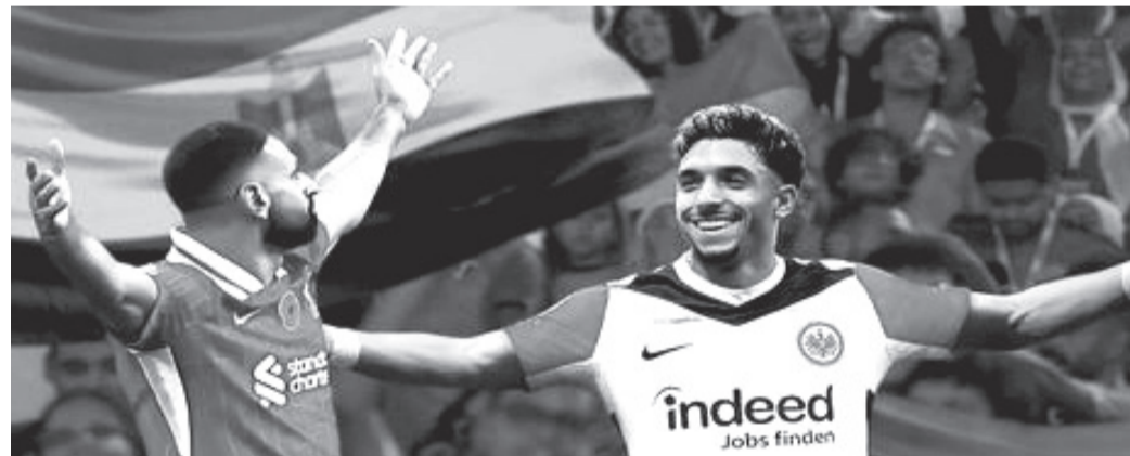
نبض البلد - وكالات

وفي حال إتمام الصفقة ستكون المواجهة المقبلة بين مانشستر سيتي وليفربول يوم ٢٣ فبراير المقبل ضمن لقاءات الدور الثاني للدوري الإنجليزي الممتاز في تمام الساعة