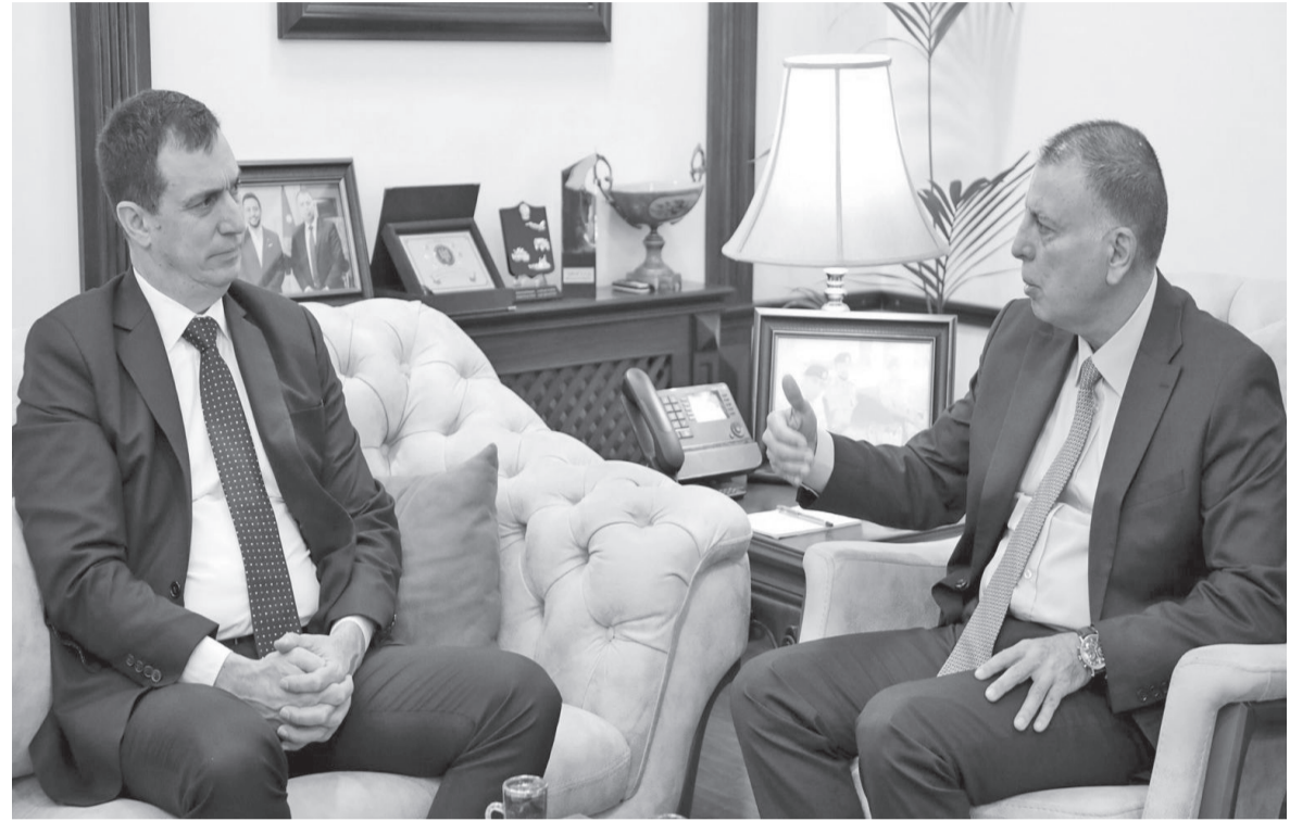
نبض البلد - عمان

بحث وزير الداخلية مازن الفراية خلال استقباله في مكتبه أمس الثلاثاء، وكيل الأمين العام للأمم المتحدة لشؤون الأمن والسلامة جيليس ميتشادو، آخر التطورات والمستجدات في المنطقة.