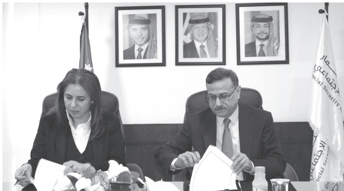
نض البلد- عمان