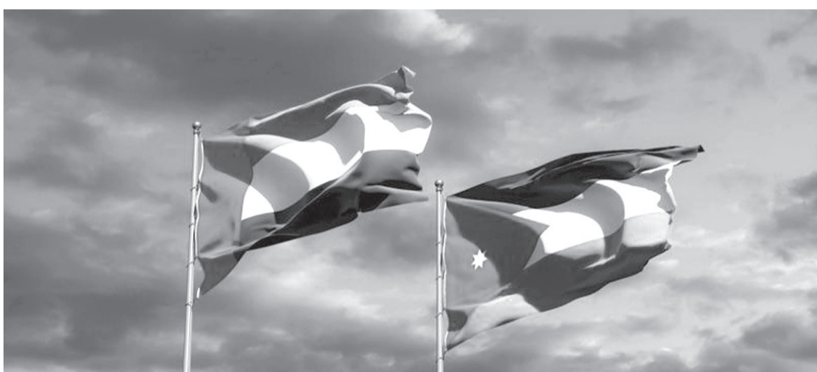
نض البلد- عمان

يبدأ وفد اقتصادي أردني اليوم الاثنين زيارة عمل إلى دولة الإمارات العربية المتحدة الشقيقة لفتح أفاق تجارية واستثمارية جديدة بين البلدين والإطلاع على تجربة