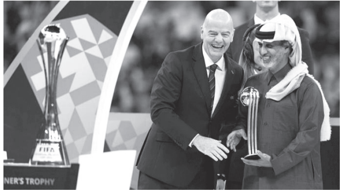
نبض البلد - وكالات

بقيادة ليونيل ميسي، وكأس آسيا ٢٠٢٣ التي أقيمت مطلع العام الماضي وفاز بها أصحاب الأرض والجمهور.