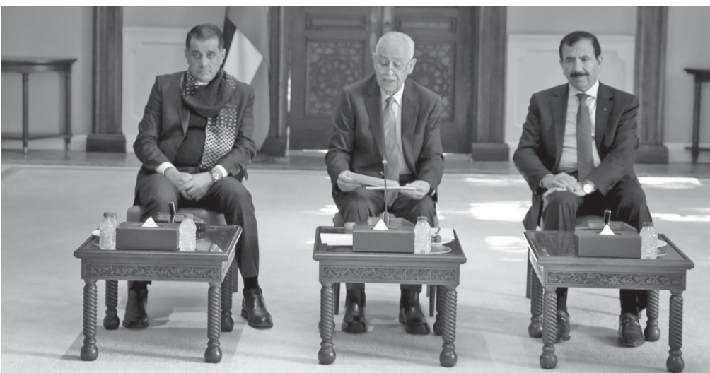
نضى البلد -عمان

قال رئيس الديوان الملكي الهاشمي يوسف حسن العيسوي أن الأردن، بحكمة قيادته الهاشمية ووعي شعبه، سيبقى أكثر منعة وقوة وصموداً وتقدماً، ماض نحو مستقبل أفضل بخطوات واثقة وأضاف العيسوي أن الأردن يشكل حالة نموذجية وفريدة، في مسيرته التحديثية والتطويرية، وفي موافقه تجاه الأزمات التي تعصف بالمنطقة.