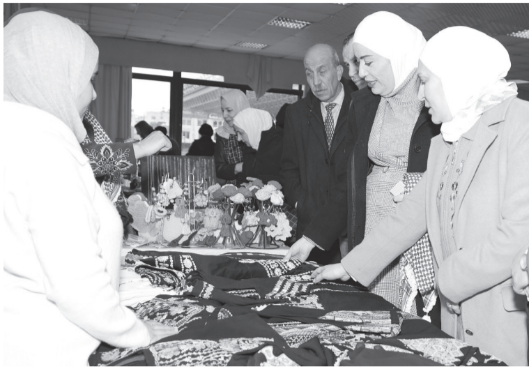
نضن البلد - أربد

يُتبعس إيجابيا على الأسر وسيدات المجتمع والوطن بأكمله ويعزز ثقافة الانتاجية، مشيرة إلى أن وزارة التنمية بالشراكة مع وزارة الزراعة ومؤسسة إعمار أربد وفرت مساحات مخصصة ضمن المعرض الدائم في أربد، لدعم الأسر المنتجة والجمعيات الخيرية التابعة للوزارة من خلال فرصة تسويق منتجاتها بصورة دائمة في إطار الاتفاقية مع وزارة الزراعة لتوفير مساحات ضمن معرضي عمان وأربد وسعي الوزارة لتذليل العقبات والتحديات أمام الأسر المنتجة والجمعيات لتسويق منتجاتها.