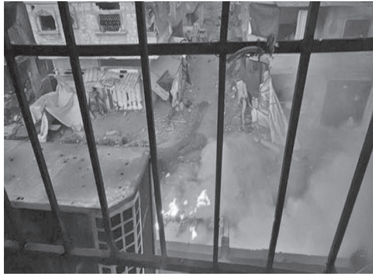
نضن البلد - عمان

والؤسسات الأممية وعلى رأسها مجلس الأمن لمحاسبة قادة الاحتلال على هذه الجريمة الكرواء بحق الإنسانية. وأضاف الصنفدي، إن دولة الاحتلال تتحمل مسؤولية سلامة المدنيين والطواقم الطبية العاملة في المستشفى، وما قامت به يعد خرقاً للقانون الدولي ومعاناً في التنكيل بالشعب الفلسطيني، الأمر الذي يستوجب محاسبة مجرمي الحرب من قادة الاحتلال، وأن يتحرك المجتمع الدولي ليتحمل مسؤولياته الأخلاقية والقانونية لوقف الحرب على القطاع وما يشهده من جرائم وحشية كان آخرها حرق مستشفى كمال عدوان ومحيطه وإخلائه بالقوة من المرضى والجرحى والطواقم الطبية والمرافقين.