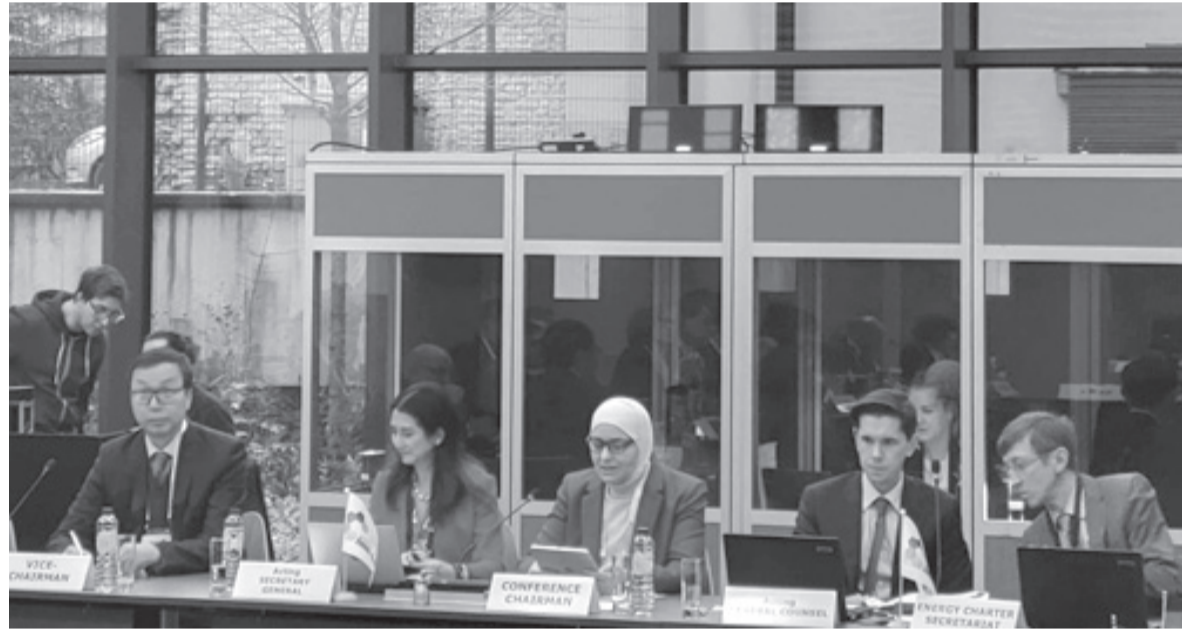
نض البلد- بروكسل

ويهدف الاجتماع إلى إنشاء خارطة طريق شاملة لتنفيذ تدابير تحديث الميثاق وتعزيز الحوار المفتوح لمعالجة قضايا الطاقة المتجددة، وتحديد الاستراتيجيات لجذب الاستثمارات في البنية التحتية للطاقة، ودعم المبادرات التي تُعزز حوكمة الطاقة في الدول الأعضاء وبما يعزز الشراكات مع المنظمات الدولية والقطاع الخاص وإنشاء آليات لرصد وتقييم الالتزامات، والتوصل إلى توافق في الآراء بشأن الاتجاهات المستقبلية لميثاق الطاقة، لضمان وضع أسس متينة لميثاق الطاقة للأجيال القادمة.