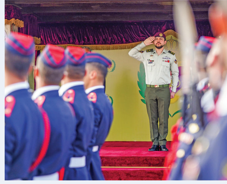
نبض البلد - الزرقاء

مندوباً عن جلالة الملك عبدالله الثاني، القائد الأعلى للقوات المسلحة، رعى سمو الأمير الحسين بن عبدالله الثاني ولي العهد، أمس الأربعاء، حفل تخريج الفوج الخامس من ضباط فرسان المستقبل (فوج البيوبيل الفضي) في الكلية العسكرية الملكية.