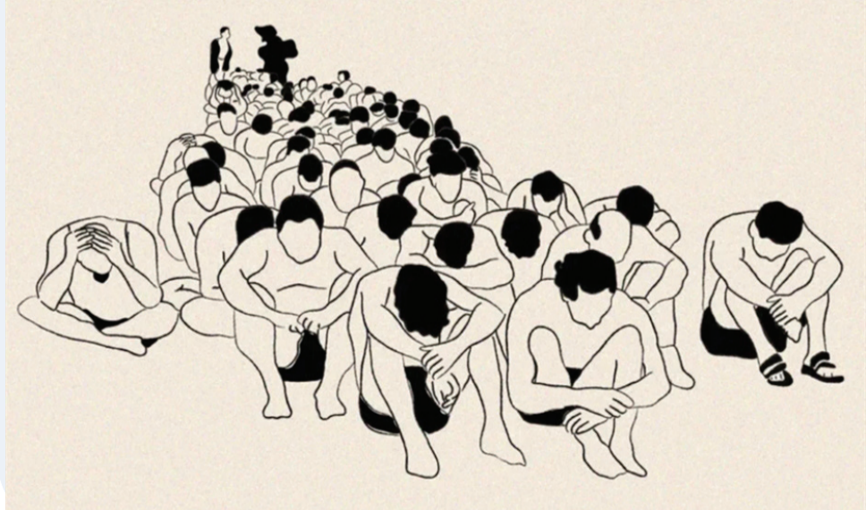
نبض البلد - وكالات

بعد دفاع المستوطنين عن جنود في الاحتلال الصهيوني، ارتكبوا جرائم اغتصاب بحق الأسرى الفلسطينيين، وصولاً إلى الاحتفاء بهؤلاء الجرمين على الشاشات العبرية، ها هو اعتراف جديد يضاف إلى لائحة الاعترافات السابقة، بما فيها أيضاً مقاطع وثقها جنود الاحتلال لجرانهم في فلسطين ولبنان ونشروها على حساباتهم الافتراضية بأنفسهم. فقد قدم مجند صهيوني سابق أول اعتراف واضح بقيام جنود الاحتلال بتعذيب الأسرى على نطاق واسع، وتحدث عن «جموع» من الفلسطينيين الرميئين أرضاً والمكبّلين بالأصفاد فيما يُسمعون «موسيقى إسرائيلية لا تنتهي» في مجمع «الحاكيريا» العسكري. وأشار إلى المنشأة على أنها «مناوبة بيت رعب» حيث الصراخ يصدر من كل الاتجاهات.