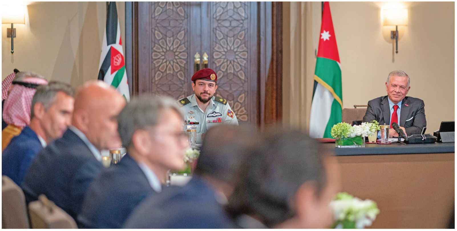
نبض البلد - عمان

أكد جلالة الملك عبدالله الثاني أن جذب الاستثمارات الخارجية أولوية للاقتصاد الأردني، وأن المملكة حرصت على تسهيل أعمال المستثمرين وتعزيز مشروعاتهم. وشدد جلالة الملك لدى اجتماعه في قصر الحسينية