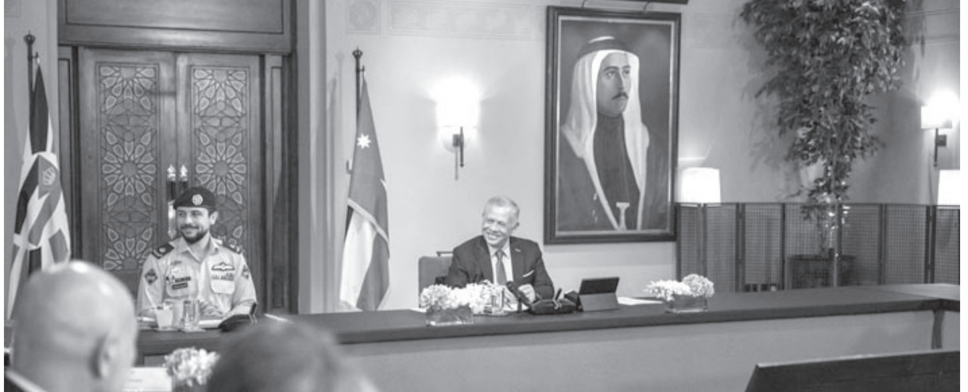
نبض البلد - عمان

وتسعى رؤية التحديث الاقتصادي إلى جذب استثمار أجنبي مباشر بقيمة 18 مليار دولار بحلول عام 2033، وهو ما سيغزز النمو المستدام. وحضر الاجتماع رئيس الوزراء الدكتور جعفر حسان، ومدير مكتب جلالة الملك، المهندس علاء البطاينة، ووزير الدولة للشؤون الاقتصادية مهند شحادة، ووزير الاستثمار المهندس مثنى غرايبة.