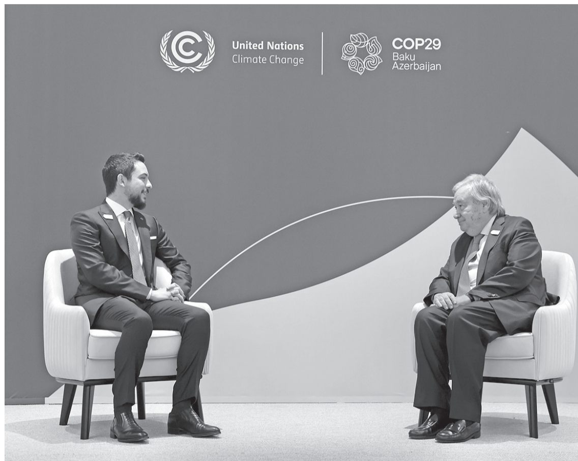
نضن البلد - باكو

(الأورو) في غزة والضفة الغربية. وأشاد سمو ولي العهد بالجهود الدبلوماسية التي يبذلها غوتيريش لتحقيق الاستقرار في المنطقة، كما ثمن الدعم الفني والتقني الذي تقدمه اليونسيف ومنظمات الأمم المتحدة العاملة في الأردن. وحضر اللقاء نائب رئيس الوزراء ووزير الخارجية وشؤون المغتربين أمين الصفي، ومدير مكتب سمو ولي العهد، الدكتور زيد البقاعين.