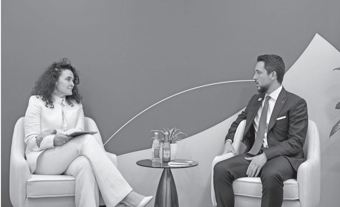
نضن البلد - باكو