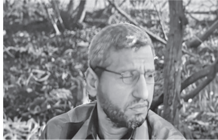
استهدفت منطقة المواصي غرب مدينة خان يونس في يوليو الماضي، بحسب مصادر

مطلعة في "حماس" وأشارت الصحفية نقلاً عن المصادر ذاتها أن قيادة الحركة داخل قطاع غزة وخارجه تلقت مؤشرات جديدة تؤكد اغتيال محمد الضيف، القائد العام لـ "كتائب القسام"، الذراع العسكرية للحركة، مبيئة أن بعض الشخصيات التي كانت تحيط بالضيف أكدت بعد عودة التواصل معها، ومع قيادة الحركة، أنه فقد الاتصال به منذ العملية التي استهدفته إلى جانب رافع سلامة، قائد لواء خان يونس في "القسام". ويواصل جيش الاحتلال الإسرائيلي حربه الشرسة على قطاع غزة، منذ السابع من أكتوبر من العام الماضي 2023، والتي راح ضحيتها حتى اللحظة إلى 43,314 شهيداً و 10,019 إصابة، بحسب وزارة الصحة في القطاع.