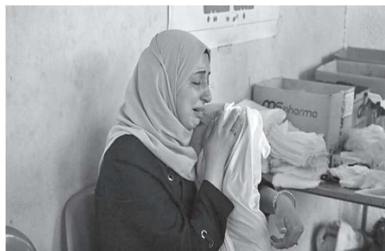
قرار مجلس الأمن الدولي بإنهائها فوراً، وأوامر محكمة العدل الدولية باتخاذ تدابير الإنساني الكارثي في غزة.

على النزوح من المخيم تحت الرصاص والقذائف.