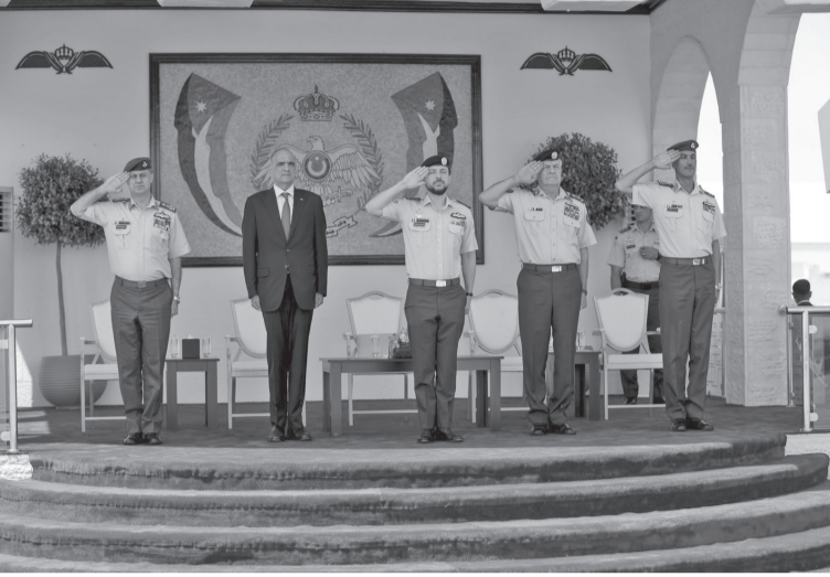
نبض البلد- المفرق

الجوية الخريجين، من حماية الوطن وصور السماء، بعد أن نهلوا من التدريب ما يؤهلهم للقيام بالواجبات والمهام التي فتح برنامج التدريب العملي بمتابعة وإشراف أعضاء هيئة تدريسية متميزة، ومدربين متميزين. وأضاف، إنه تم تحديث مناهج الطيران، وإدخال طائرة (Bell ٥٠) للتدريب على الطيران العمودي المتقدم، فضلاً عن فتح برنامج التجسير الخاص بالضباط خريجي كلية الملك الحسين الجوية، وبرنامج في الدبلوم المهني. وقلد نائب جلالة الملك الأجنحة للخريجين والخريجات، ووزع الجوائز التقديرية على الحاصلين على المراكز الأولى في تخصصاتهم.