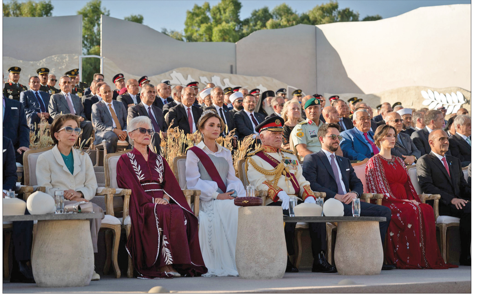
نيض البلد- عمان

* هويتنا الوطنية الأردنية مصدر ثبات وقوة تجمعنا في مواجهة الأخطار