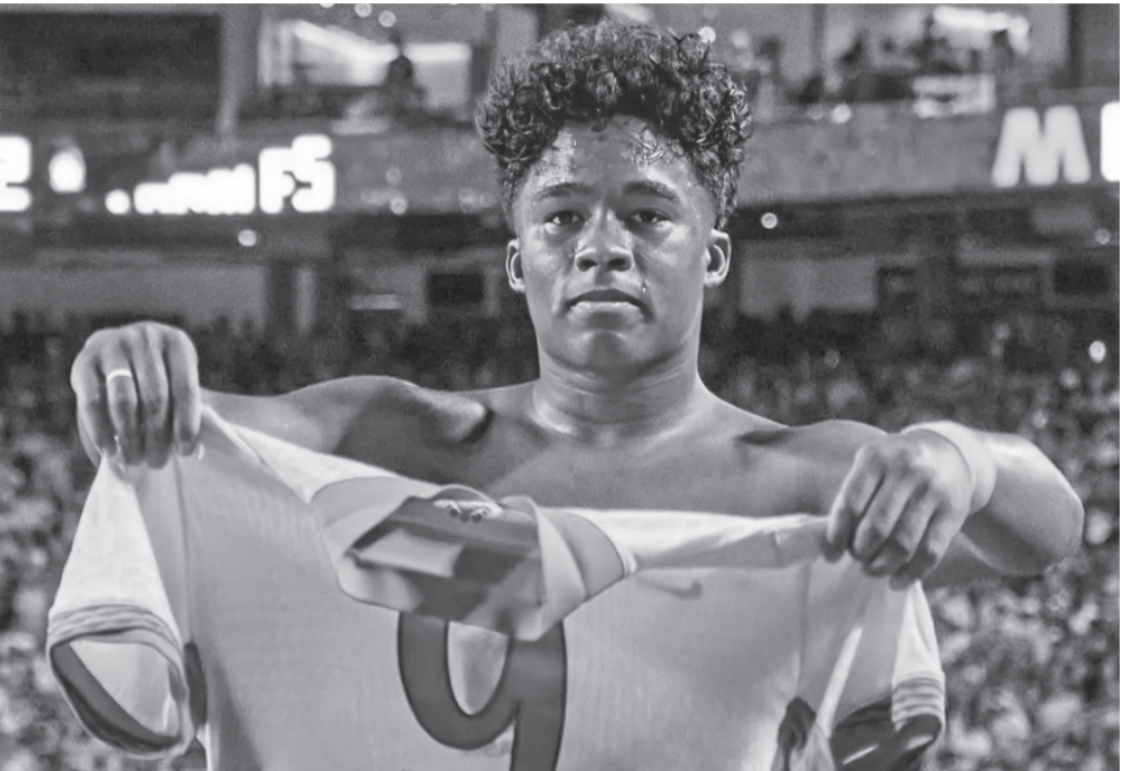
الأسطورة بيليه الذي يسجل ٣ أهداف لمنتخب "السامبا" في تاريخ البرازيل.