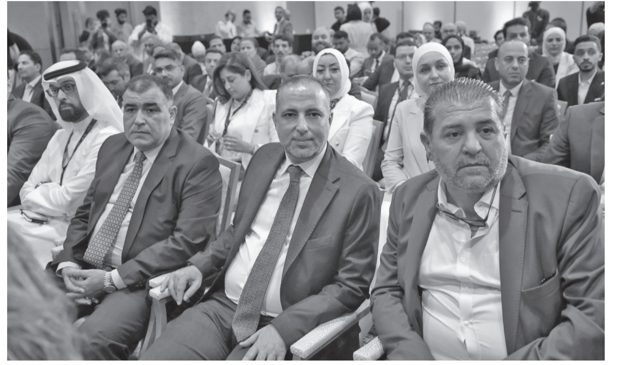
نبض البلد - عمان تصوير: رجاوي البليسي

افتتح وزير الاتصال الحكومي الناطق الرسمي باسم الحكومة الدكتور مهند المبيضين أمس الثلاثاء، فعاليات نسخة الأولى من منتدى الأردن للإعلام والاتصال الرقمي.