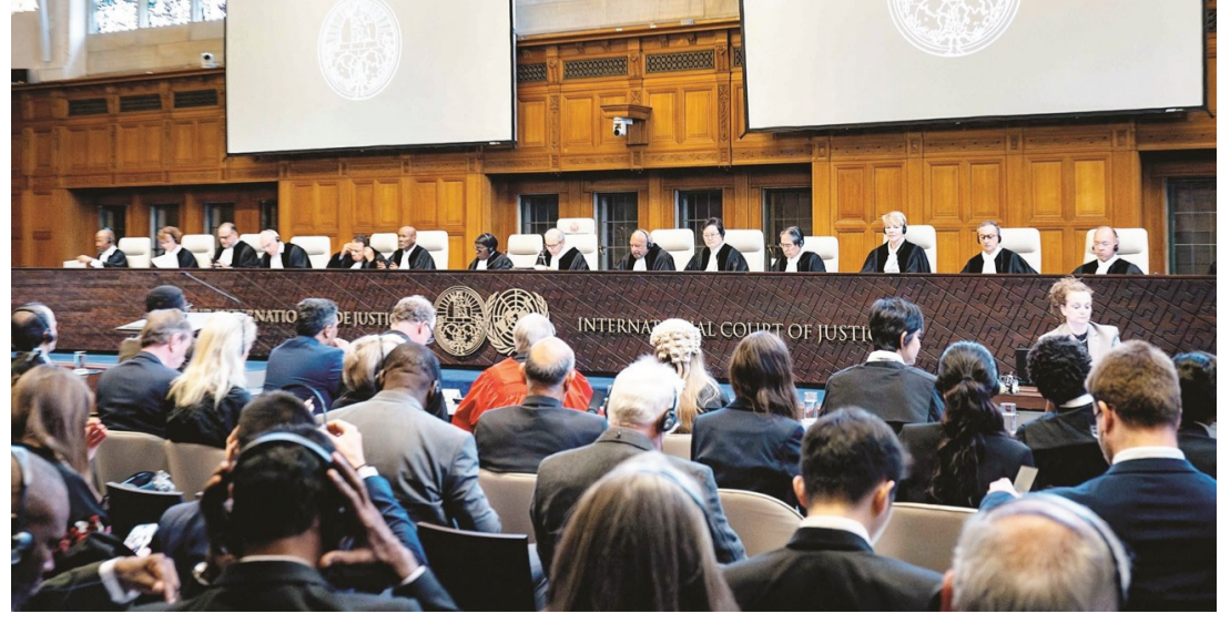
بدأت في إسرائيل، أمس، مشاورات طارئة عقب إعلان المدعي العام في المحكمة الجنائية الدولية، كريم خان، تقديمه طلباً إلى المحكمة لإصدار مذكرات توقيف دولية ضد رئيس الوزراء، بنيامين نتانياهو، ووزير الأمن يوآف غالانت، بتهم ارتكاب جرائم تشمل، التتجوع، والقتل العمد، والإبادة وأو القتل، وأخرى مماثلة ضد رئيس حركة حماس، في غزة، يحيى السنوار، وقائد، كتائب القسام، محمد الضيف، ورئيس المكتب السياسي للحركة، اسماعيل هنية، بزعم ارتكابهم جرائم حرب، وجرائم ضد الإنسانية، خلال هجوم السابع من أكتوبر. ووصف نتانياهو القرار بالفضيحة، معلنًا، في اجتماع كتلة الليكود، أن ذلك لن يوقفني أو يوقفكم (عن استكمال الحرب).