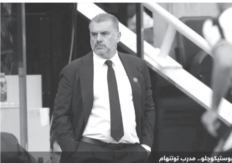
بوستيكلو.. مدرب توتنهام