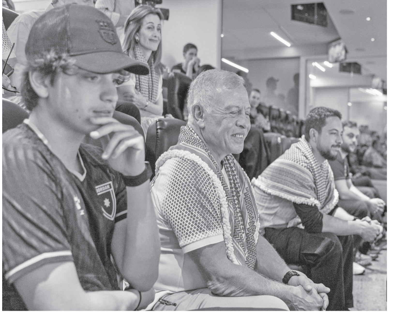
نضن البلد - عمان

وجه جلالته الملك عبدالله الثاني تحية فخر واعتزاز إلى نشامى المنتخب الوطني لكرة القدم وإلى الجماهير