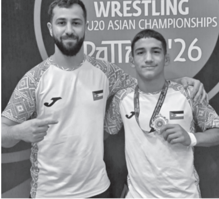
نضن البلد - عمان