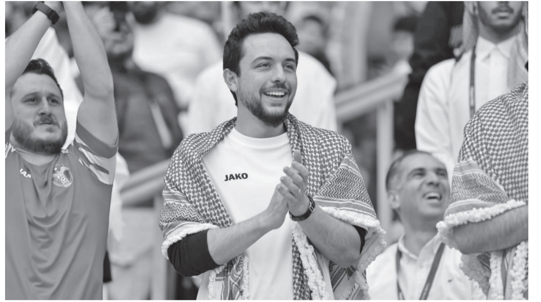
نبض البلد - مينا س بني ياسين

قبل سنوات قليلة، كان الحديث عن حضور أردني مؤثر في كبرى المحافل الرياضية العالمية يبدو متوحيها بعيد المنال، أما اليوم فقد أصبحت الرياضة الأردنية رقما صعبا على المستويين الإقليمي والدولي، مدفوعة بسلسلة من الإنجازات التاريخية التي تحققت في مختلف الألعاب، وبمنظومة دعم متواصلة كان لاتمام القيادة الهاشمية ومتابعة سمو الأمير الحسين بن عبدالله الثاني، ولي العهد، دور محوري. في ترسيخها وتعزيزها. ومع احتفال المملكة بعيد ميلاد سمو ولي العهد الثاني والثلاثين، يستحضر الرياضيون والمسؤولون في القطاع الرياضي الأردني محطات