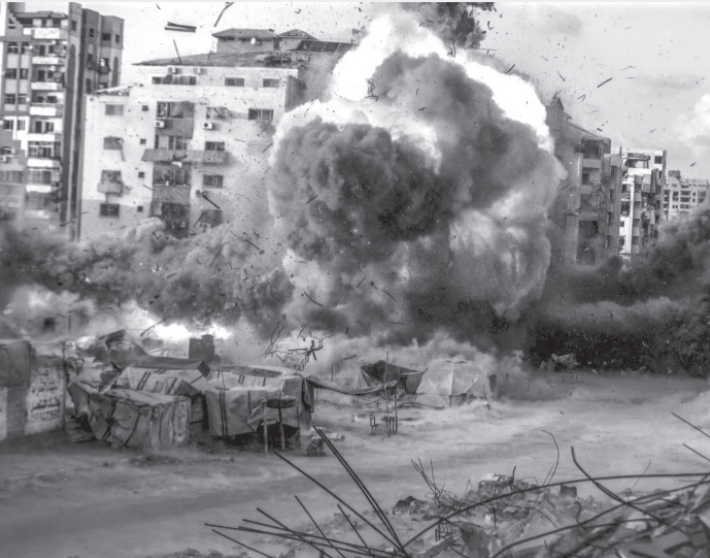
نبض البلد- وكالات

القانوني ودعم مطالب فتح تحقيق جنائي حول طبيعة تورط الشركة ودورها في توريد مواد يُشتبه باستخدامها في القصف.