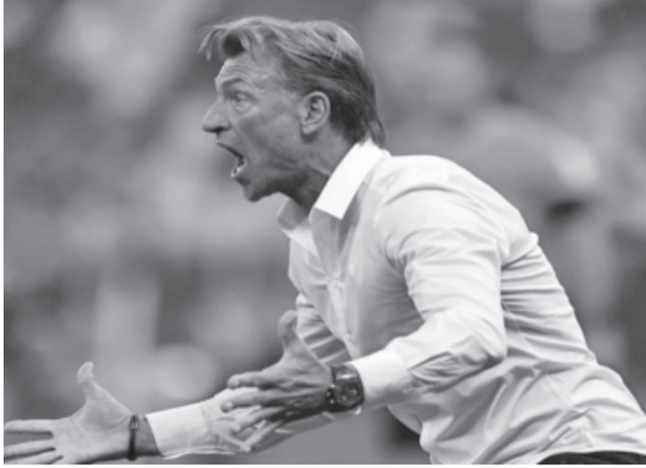
نبض البلد - وكالات

بنتيجة ١-٥ في افتتاح مشواره بالمجموعة السادسة من كأس العالم ٢٠٢٦ المقامة في الولايات المتحدة وكندا والمكسيك. وكان رينارد قد أنهى تجربته مع المنتخب السعودي قبل شهرين فقط من انطلاق البطولة بعد سلسلة من النتائج غير المرضية والعروض المتواضعة خلال المباريات الودية التحضيرية. وتمثل نسخة ٢٠٢٦ ثالث مشاركة متتالية لرينارد في نهائيات كأس العالم بعدما قاد منتخب المغرب في مونديال ٢٠١٨، ثم المنتخب السعودي في نسخة ٢٠٢٢ قبل أن يتولى الآن مهمة قيادة المنتخب التونسي. ويقبع المنتخب التونسي حالياً في المركز الأخير بالمجموعة السادسة دون نقاط عقب خسارته الافتتاحية أمام السويد ويستعد لخوض مواجهتين مصيريتين أمام اليابان وهولندا من أجل الحفاظ على آماله في التآهل إلى الدور المقبل.