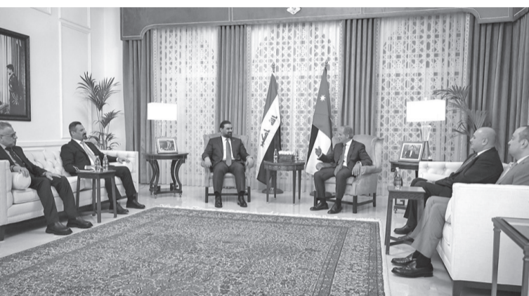
النجداوي، والنائب الأول لرئيس مجلس النواب النائب خميس عطية.

مشدداً على أن أمن العراق جزء لا يتجزأ من أمن الأردن والمنطقة. كما جرى التأكيد على ضرورة المضي قدماً في المشاريع المشتركة بين البلدين في مجالات الطاقة والكهرباء والتبادل الاقتصادي والتجاري، وأهمية بذل أقصى الجهود لتسهيل حركة التجارة والتعاون بين القطاع الخاص ورجال الأعمال من كلا البلدين، خصوصاً في ظل ما تشهده المنطقة من ظروف وتحديات تؤكد أهمية التعاون المشترك للحد من تداعياتها. وحضر اللقاء وزير الشؤون السياسية والبرلمانية عبد المنعم العودات، ووزير دولة لشؤون رئاسة الوزراء عبد اللطيف