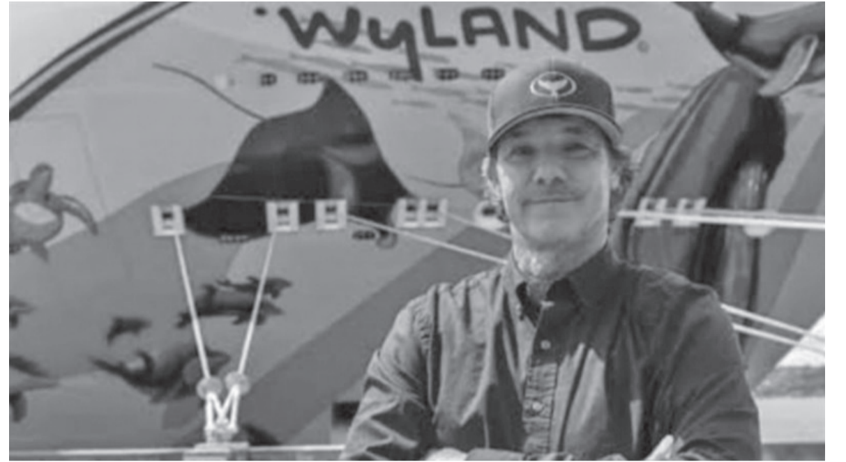
نضن البلد- وكالات

حيث تتسارع وتيرة الاستعدادات لاستضافة المونديال الأكبر في التاريخ بمشاركة ٤٨ منتخباً. وتواجه المدن المستضيفة تحديات موازنة بين تحديث البنية التحتية والحفاظ على الهوية الثقافية والمعالم التاريخية التي تميزها. ويرى مراقبون أن هذه القضية قد تفتح الباب أمام نقاشات أوسع حول حدود سلطة المنظمات الدولية والجهات الحكومية في تغيير ملامح المدن. فالشارع الكبرى المرتبطة بالأحداث الرياضية غالباً ما تصطدم بمصالح المجتمعات المحلية وحقوق المبدعين في الحفاظ على أعمالهم. إن الجدارية التي أزيلت لم تكن مجرد عنصر تجميلي، بل تحولت بمرور الزمن إلى جزء من الذاكرة الجماعية لسكان دالاس. ويجادل المدافعون عن وايلاند بأن إتلاف مثل هذه الأعمال يمثل خسارة ثقافية لا يمكن تعويضها بالمال، رغم ضخامة المبلغ المطلوب في الدعوى. وتسلم القضية الضوء على «الحقوق