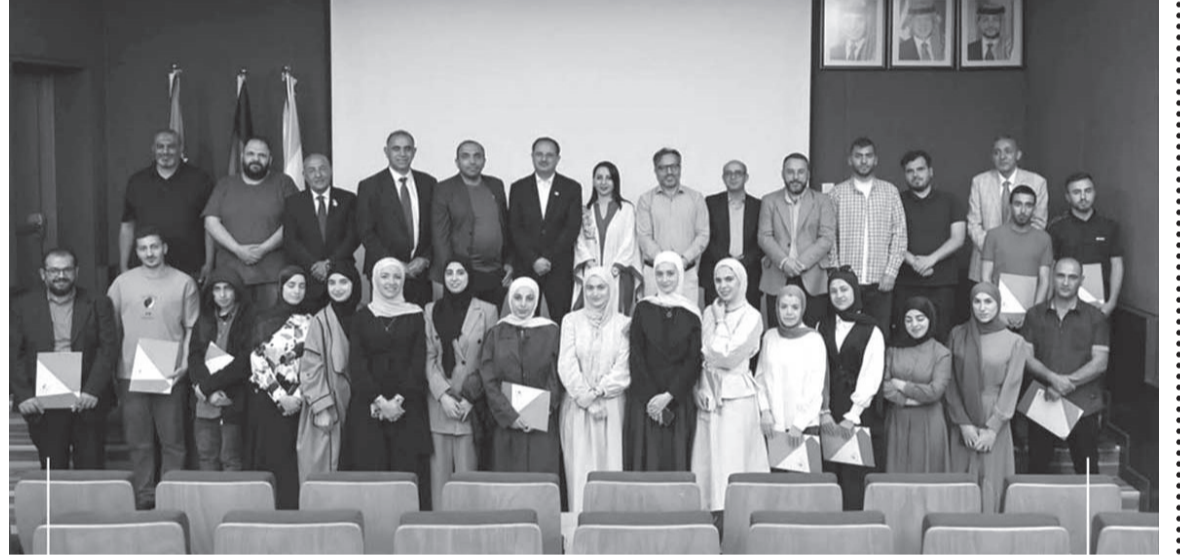
نبض البلد- مادبا

بمشاركة طلبة وباحثين من الأردن وفلسطين. وأكد رئيس الجامعة الألمانية، الدكتور علاء الدين الحلواني، خلال رعايته حفل تكريم المشاركين الذين أتموا البرنامج التدريبي