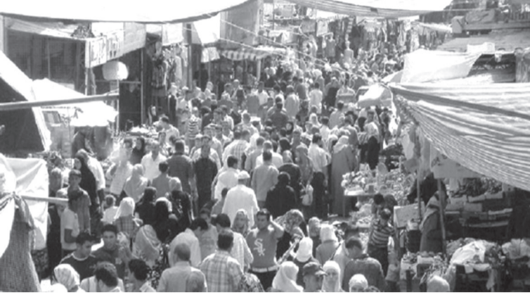
مختلف مناطق المحافظة.