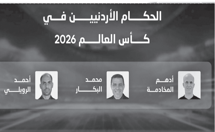
الحكام الأردنيين في كأس العالم 2026