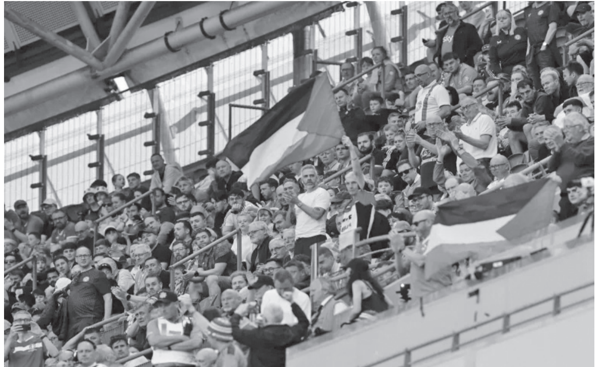
نبض البلد - وكالات

تحوّلت المباراة الودية التي جمعت بين منتخبى أيرلندا وقطر في العاصمة دبلن إلى منصة كبرى للتضامن مع القضية الفلسطينية، حيث شهد ملعب «أفيبا» سلسلة من الاحتجاجات الجماهيرية التي أدت إلى توقف اللقاء مؤقتاً. ورفعت الجماهير الأيرلندية الإعلام الفلسطيني بكثافة في المدرجات، تزامناً مع هتافات تطالب بعزل منتخبات الاحتلال عن المسابقات الرياضية الدولية رداً على الجرائم المستمرة بحق الشعب الفلسطيني.