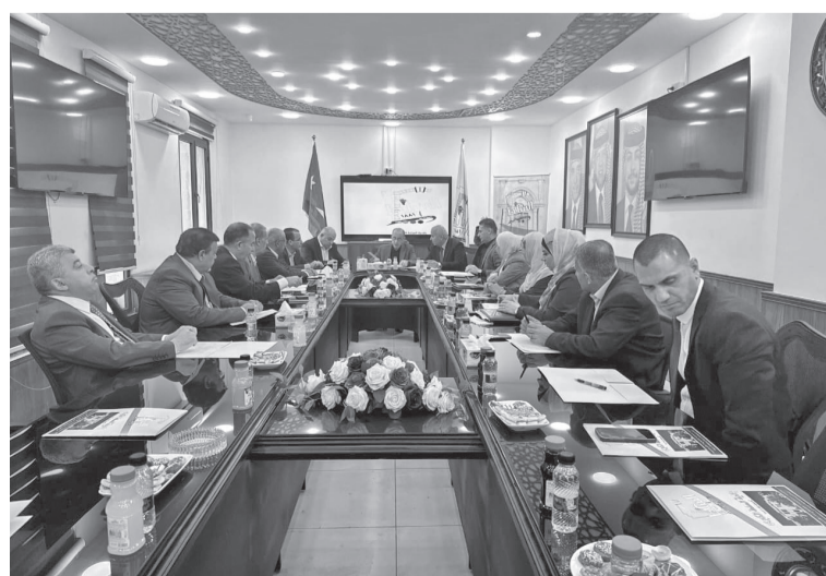
العام للشؤون الفنية أشرف أبو السمن،

جاء ذلك خلال زيارته امس السبت، بلدية السلط الكبرى، ولاقته برؤساء لجان بلديات محافظة البلقاء، ورئيس لجنة مجلس المحافظة، ورؤساء مجالس الخدمات، ومدير هندسة البلديات، يرافقه الأمين العام للشؤون