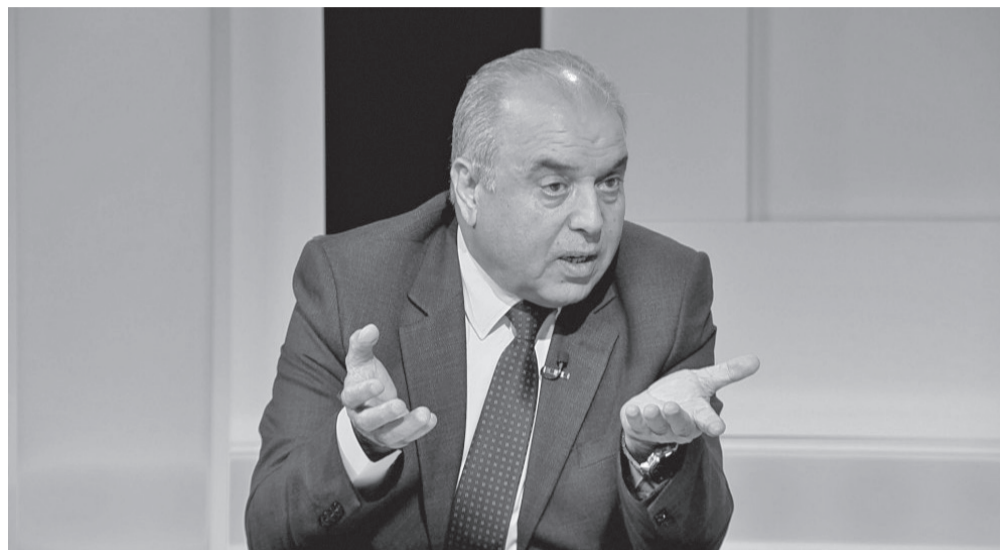
نضن البلد- عمان

عموم وزير التربية والتعليم ووزير التعليم العالي والبحث العلمي عزمي محافظة، على جميع رؤساء الجامعات