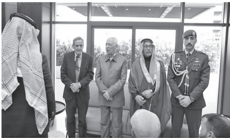
نضن البلد- عمان