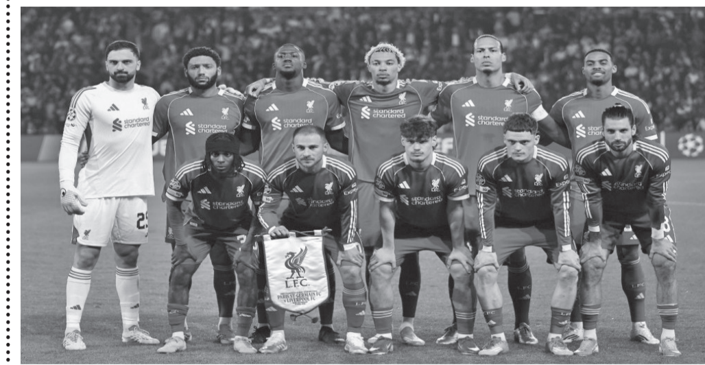
نبض البلد - وكالات

يستحضر ليفربول الأمسية التاريخية على ملعبه «أنفيلد»، أمام برشلونة قبل ٧ سنوات قبل مواجهة باريس سان جرمان الفرنسي، حامل اللقب، في إياب الدور ربع النهائي من مسابقة دوري أبطال أوروبا الثلاثاء وانقاد موسم مخيب للأمل للغاية. بعد تنويعهم أبطالاً لا يكتفون قبل أقل من عام، يحتل «الريدز»، المركز الخامس في الدوري هذا الموسم، وقد خرجوا خاليي الوفاض من مسابقتي الكأس وكأس الرابطة. وتمثل المسابقة القارية الأهم فرصة أخيرة لعدم خروج ليفربول بعلامة صفر هذا الموسم، لكنها فرصة ضئيلة بعدما تفوق عليه سان جرمان ٢-٠ ذهاباً على ملعب «بارك دي برانس». ولا يزال ليفربول، بطل أوروبا ست مرات، يحتفظ بخيط رفيع للبقاء على قيد الحياة في دوري الأبطال حيث يدين بذلك إلى النادي الباريسي الذي أهدر كما هائلاً من الفرص، في حين كان قد تغلب على صعب أكبر في الماضي تحت أضواء ملعب «أنفيلد».