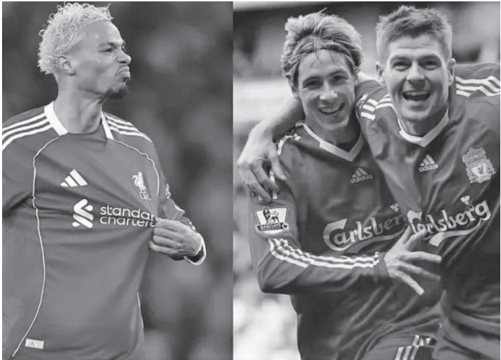
نفض البلد- وكالات

كان يغادر الملعب، ذكّر مهاجم باريس سان جيرمان السابق جماهير نيوكاسل بمساهمته بهدفين من خلال رفع أصابعه.