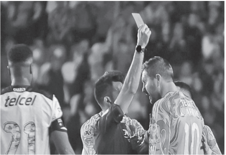
نفض البلد

عام ٢٠٢٠ في الدوري، ثم أمام أورلاندو الأميركي عام ٢٠٢٣ في مسابقة دوري أبطال الكونتكاف، بفضل تدخل حكم الفيديو المساعد (في آيه آر).