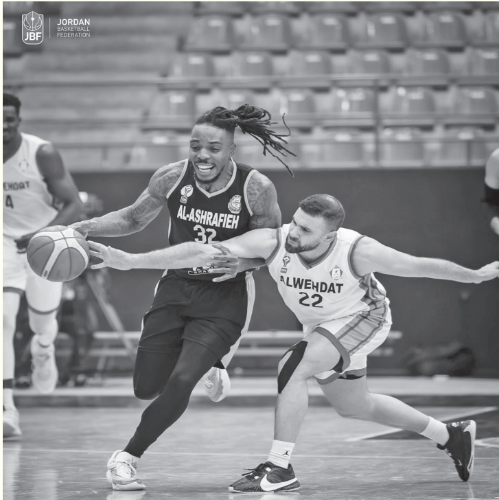
نبض البلد - عمان

وجاءت المباراة ضمن مباريات الجولة ١٢ من إياب المرحلة الأولى، حيث شهدت تنافساً بين الفريقين على مدار فترات اللقاء، قبل أن يحسم الوحدات النتيجة لصالحه. وتتواصل منافسات دوري CFI الممتاز خلال الفترة المقبلة، مع استمرار إقامة مباريات الجولات المتبقية من المرحلة الأولى لبطولة.