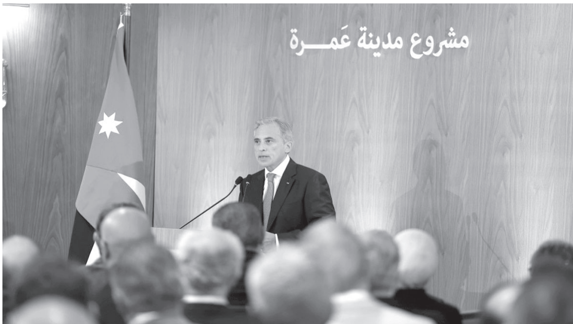
وممثلين عن النقابات ذات العلاقة.

وتأتي الجلسات في إطار سعي الحكومة لإشراك الخبراء الأردنيين في تطوير التصاميم الخاصة بمشروع مدينة عمرة، والمشاريع المنبثقة عنها، خصوصاً المرحلة الأولى التي تضمّ مشاريع استثمارية إنتاجية تشمل مركزاً دولياً للمعارض والمؤتمرات، ومدينة رياضية