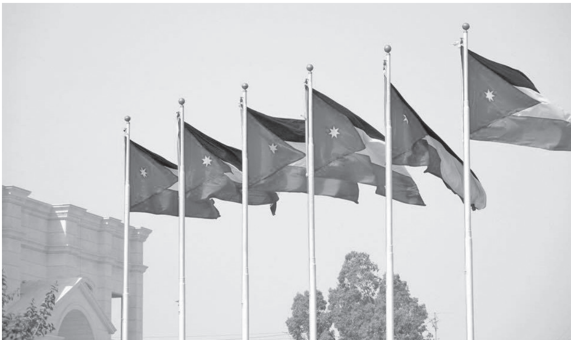
بطولة كأس العرب.