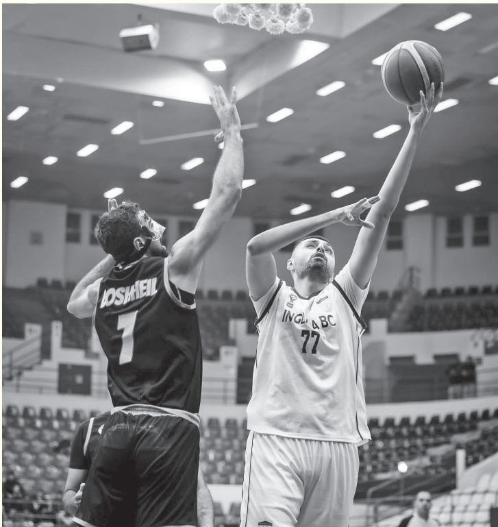
نبض البلد - عمان

وجاءت المباراة، ضمن مباريات الجولة ١٢ من إياب المرحلة الأولى، حيث فرض فريق الإنجليزية أفضليته على مجريات اللقاء، لبنيها المباراة لصالحه بفارق مرجح. وتتواصل منافسات دوري CFI الممتاز خلال الأيام المقبلة، مع استمرار إقامة مباريات المرحلة الأولى من البطولة.