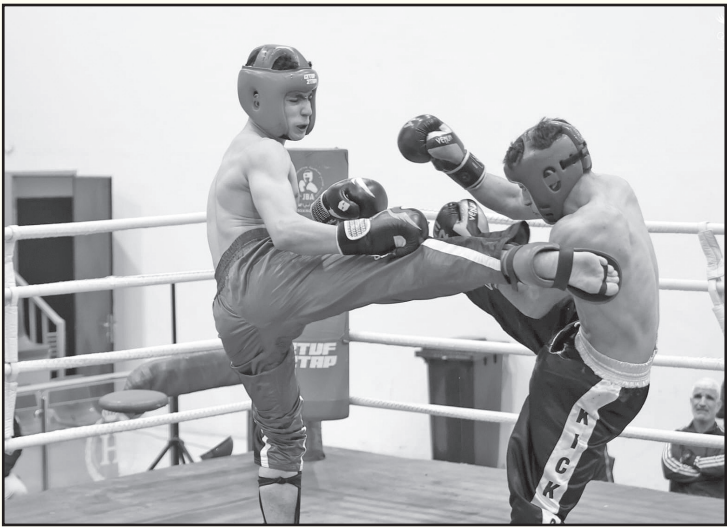
نبض البلد- عمان

اليوم السبت، شهدت مشاركة ٣٦٠ لاعباً يُمثلون ٣٦ نادياً ومركزاً. وتأتي هذه البطولة لاختيار عناصر المنتخب الوطني، استعداداً للاستحقاقات الدولية هذا العام، بما فيها بطولة العالم للشباب، والتي تستضيفها إيطاليا في أيلول المقبل.