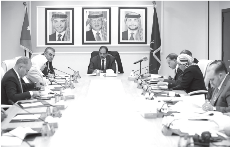
يتوافق مع المبادئ الدستورية.