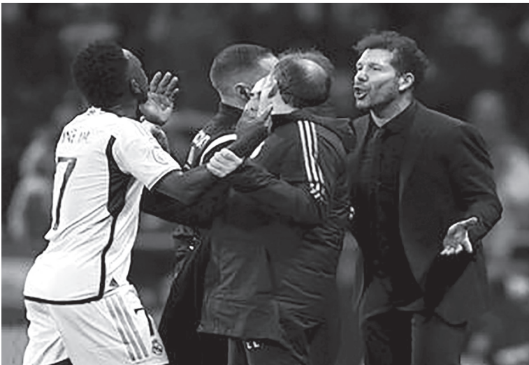
نبض البلد – وكالات

أعرب ديفغو سيميوني مدرب أتليتيكو مدريد عن أسفه لسخريته من فينيسيوس جونيور واعتذر عن تصرفاته خلال خسارة فريقه في قبل نهائي كأس السوبر الإسبانية لكرة القدم أمام ريال مدريد.