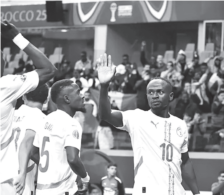
نبض البلد – وكالات

لقطات مثيرة للجدل شهدها مران المنتخب السنغالي قبل لقاء المنتخب المصري في نصف نهائي كأس أمم أفريقيا (المغرب ٢٠٢٥)، حيث من المقرر أن تقام المباراة مساء الأربعاء. ولفت الأنظار قيام عدد من اللاعبين بالإشارة بحركة «في الجيب»، الأمر الذي أثار الجدل في المعسكر المصري، وتسبب في غضب الجماهير المصرية عبر مواقع التواصل الاجتماعي.