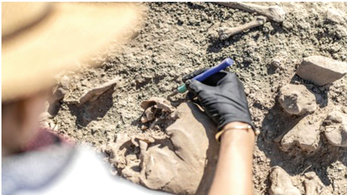
نبض البلد – عمان

كشفت علماء آثار وأثنروبولوجيا عن بقايا بشرية قديمة في المغرب قد تمثل مرحلة مفصلية في تاريخ تطور الإنسان، وتوفر أدلة جديدة على العلاقة بين السلالات البشرية الإفريقية والأوراسية.