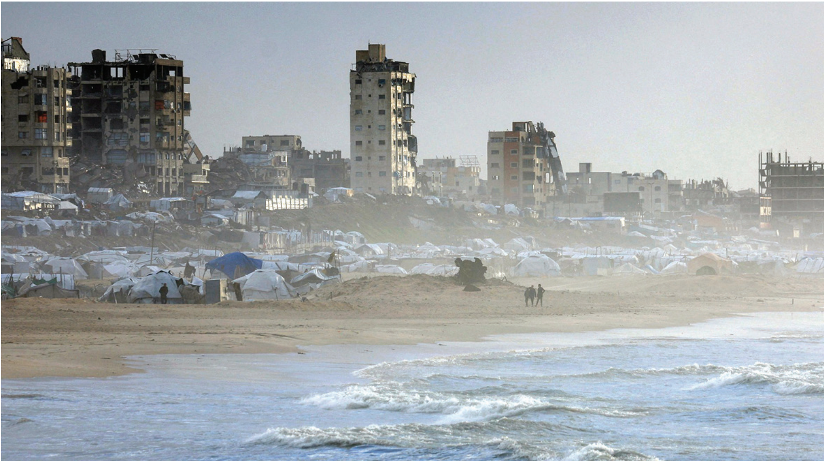
نبض البلد – عمان

التي خلفتها منخفضات سيقته، كان آخرها في الثامن والتاسع من يناير/كانون الثاني الجاري.