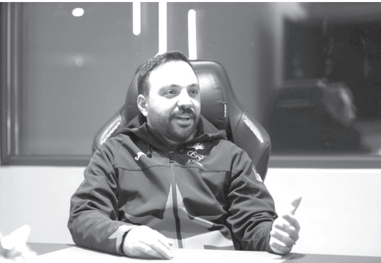
نبض البلد – عمان

الرياضات الإلكترونية في الأردن،. وأشار أبو غوش إلى أن الاتحاد استضاف في عام ٢٠٢٥ بطولات إقليمية؛ بطولتين في عمّان وأخرى في العقبة. حيث استضافت العقبة بطولة زين إي سبورت غرب آسيا لكرة القدم الإلكترونية، فيما أقيمت في عمّان بطولة الدوري العربي للرياضات الإلكترونية، إلى جانب بطولة (MENA Cup) لسباقات محاكاة السيارات بالتعاون مع الأردنية لرياضة السيارات.