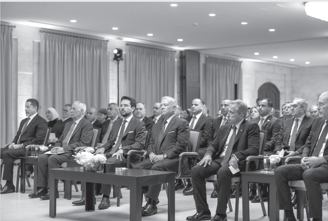
نبض البلد – عمان

رئيس الوزراء أنه وبدون جهاز إدارة عامة كفؤ وفاعل لا يمكن إجاح البرامج الاقتصادية، لذا فإن التطوير الجاري في قطاع الإدارة العامة، الذي يعني بأكثر من ربع مليون موظف، أمر أساسي ومستمر، ولفت إلى التوجه لإنشاء الأكاديمية الوطنية للإدارة العامة التي سيكون لها دور مهم في إعداد جهاز قادر على تقديم الخدمة الأفضل للمواطنين، بالإضافة إلى العمل الدؤوب على شمولية برامج الرقمنة في هذا القطاع. وفيما يتعلق بمحور الحماية الاجتماعية، أشار الدكتور حسان إلى أن تنفيذ الاستراتيجية الوطنية للحماية الاجتماعية، التي أطلقت قبل أشهر، يأتي في صلب اهتمام الحكومة، مضيفا أنها تعنى بتأمين الفئات المستهدفة من خلال برامج متعددة، مثل شمول جميع المستفيدين