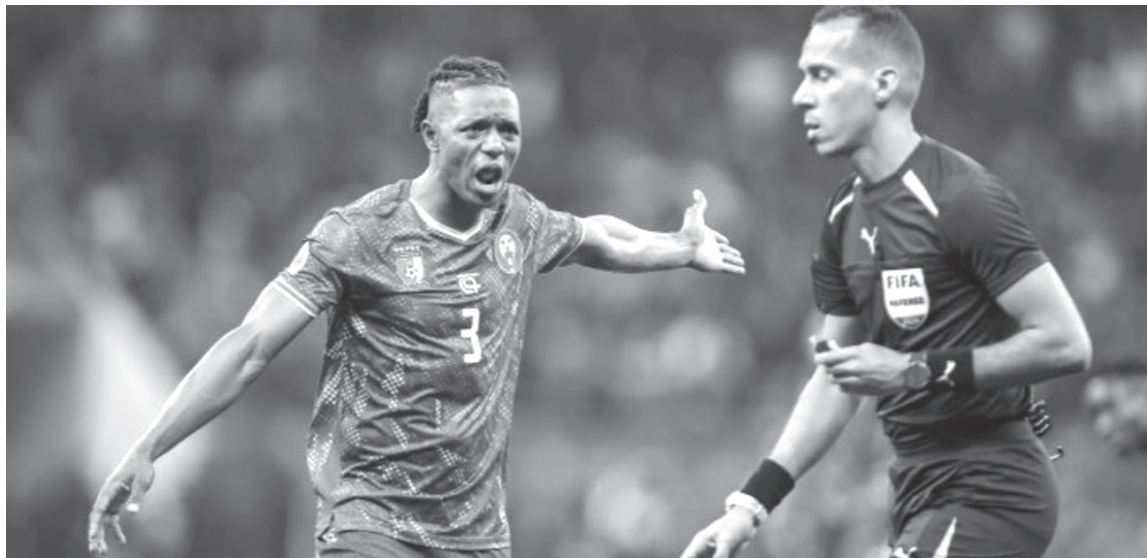
نبض البلد – وكالات

الأخيرة وأدلة مصوّرة تشير إلى سلوك قد يكون غير مقبول من بعض اللاعبين والمسؤولين، وفتحنا تحقيقاً بخصوص الأحداث التي شهدتها مباراتاً الدور ربع النهائي بين الكاميرون والمغرب، وكذلك بين الجزائر ونيجيريا.. وتابع البيان: