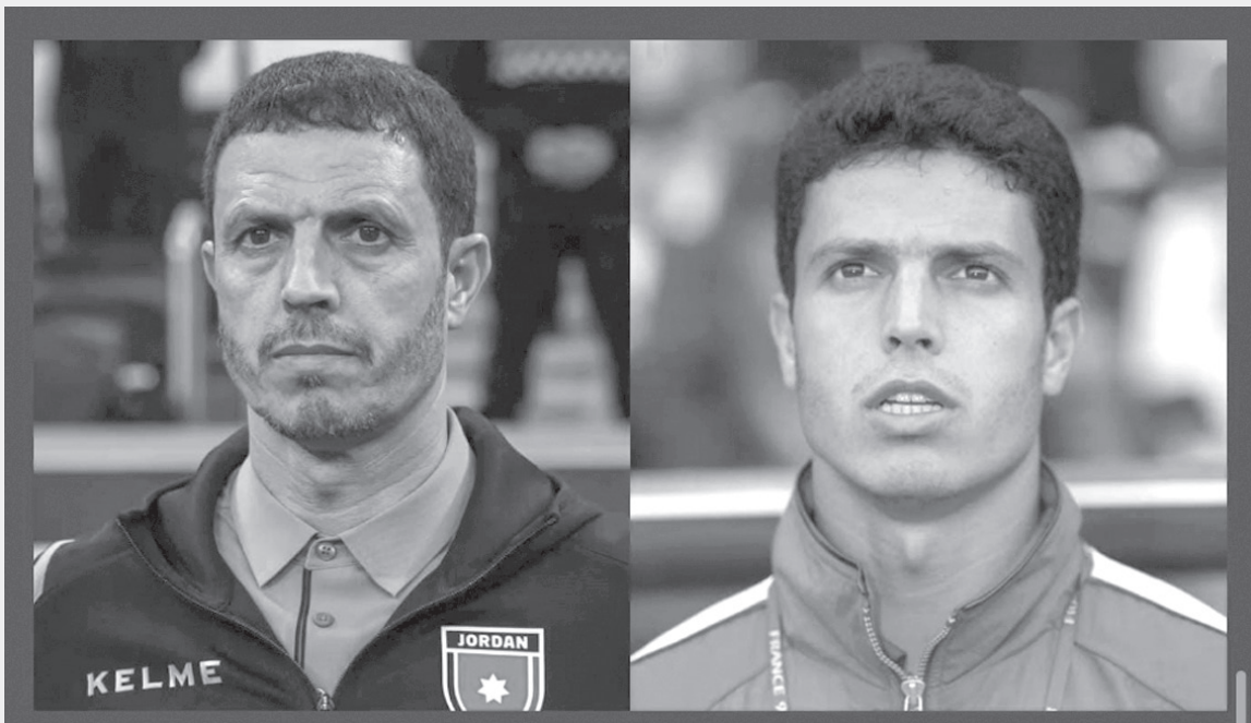
الأنباط – عمان

لاعبا في نهائيات كأس العالم فرنسا ١٩٩٨، بات اليوم ضمن نخبة من المدربين العالميين الذين سيحضرون مونديال ٢٠٢٦ من على دكة التدريب، إلى جانب أسماء بارزة في عالم كرة القدم، من بينها الفرنسي ديديه ديشامب، والارجنتيني