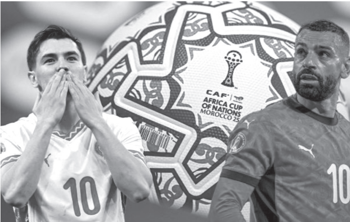
نبض البلد – وكالات

النيجيري أديمولا لوكمان، إلى جانب المغربي أيوب الكعبي، في سياق تهديفي مفتوح قبل نصف النهائي، فيما يملك لاعب ساحل العاج آماد دبالو، والجزائري رياض محرز، ولاعب منتخب مالي لاسين سيناكو، ٣ أهداف أيضاً لكل منهم، لكنهم باتوا خارج سياق المنافسة، إثر وداع منتخباتهم العرس القاري. من جهة أخرى، ويأتي النيجيري أديمولا لوكمان تألقه اللافت في البطولة القارية، بتصدره قائمة صانعي الأهداف، برصيد أربع تمريرات حاسمة، مؤكداً تأثيره الكبير في مشوار منتخب بلاده. ويأتي السنغالي ساديو ماني في المركز الثاني بثلاث تمريرات، فيما جاء ثنائي منتخب نيجيريا أكور أدامز وأليكس إيبوي إلى جانب الجزائري أنيس حاج موسى في المركز الثالث، برصيد تمريرتين حاسمتين لكل منهم، في سياق يشهد تنافساً واضحاً على صناعة اللعب.