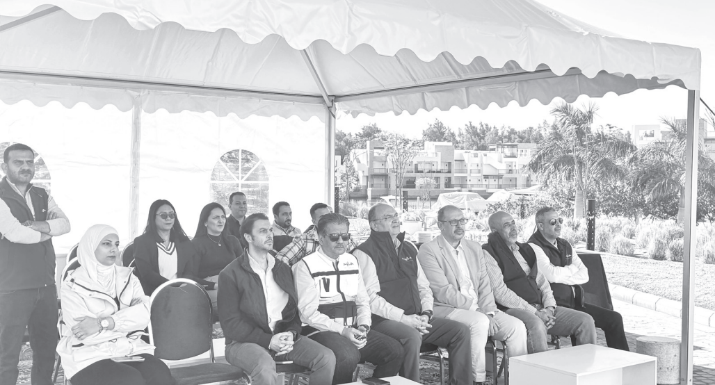
نبض البلد - العقبة

اجرت شركة واحة أيلة للتطوير صباح يوم أمس الثلاثاء الموافق ٢٣ كانون الأول ٢٠٢٥ تمرين حريق مشترك، وذلك ضمن خطتها السنوية الهادفة إلى تعزيز جاهزية كوادرها والشركاء ورفع مستوى الاستعداد والاستجابة للطوارئ، بما ينسجم مع أعلى معايير الأمن والسلامة والبيئة.