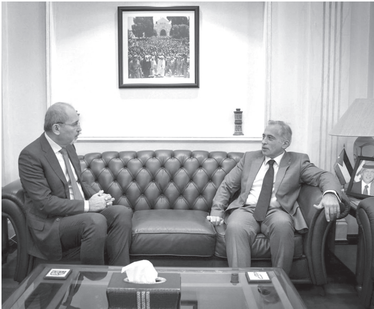
نبض البلد – عمان

للمغتربين الأردنيين وتشغيل الدور الاقتصادي للبعثات الدبلوماسية الأردنية. وشدد رئيس الوزراء على أهمية استمرار التنسيق بين وزارة الخارجية والوزارات الاقتصادية من أجل زيادة فاعلية الدور الاقتصادي للبعثات الدبلوماسية، وخصوصا في جهود تشجيع الاستثمار والسياحة والصادرات. كما أكد رئيس الوزراء دعم جهود أمتة الخدمات القنصلية وتطويرها بهدف تقديم هذه الخدمات بشكل فعال للمغتربين الأردنيين.