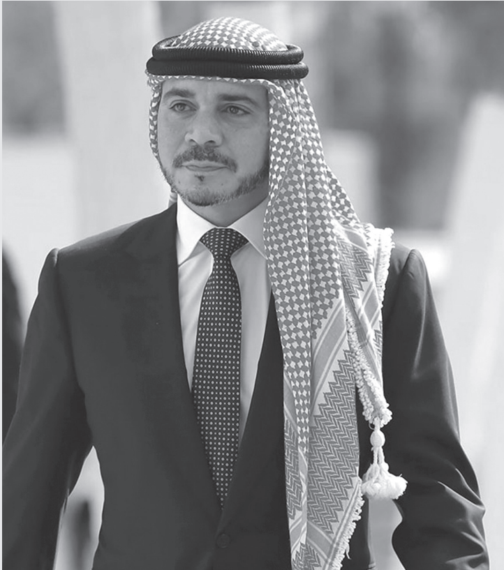
نبض البلد – عمان

يصادف يوم أمس الثلاثاء، عيد ميلاد سمو الأمير علي بن الحسين. ولد سموه في الثالث والعشرين من شهر كانون الأول عام ١٩٧٥، لصاحبي الجلالة المغفور لهما، بإذن الله، الملك الحسين والملكة علياء طيب الله ثراهما. وبدأ سموه دراسته الابتدائية في الكلية العلمية الإسلامية في عمان وتابعها في المملكة المتحدة والولايات المتحدة، إذ تخرج من مدرسة ساليسبوري في ولاية كونيتيكت عام ١٩٩٣، وتميز سموه في رياضة المصارعة. والتحق سموه بأكاديمية ساندهيرست العسكرية الملكية، حيث تخرج ضابطاً في كانون الأول ١٩٩٤، ونال وسام برونائي. وقبل متابعته الدراسة في الولايات المتحدة، خدم سمو الأمير علي في القوات الخاصة في القوات المسلحة الأردنية – الجيش العربي، وحاز على أجنحة المظليين في القفز الحر. وتم تعيين سموه قائدا لمجموعة الأمن الخاص لجلالة القائد الأعلى في الحرس الملكي عام ١٩٩٩، وخدم سموه في هذا المنصب حتى ٢٨ كانون الثاني ٢٠٠٨، إلى أن أناط به