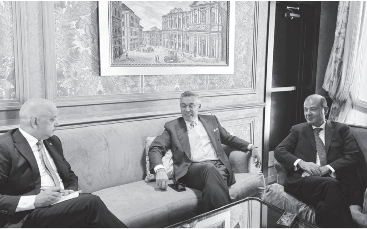
نبض البلد – عمان

منحة تدريبية متكاملة لخريجي الجامعات من حملة الشهادات الجامعية الأولى الذين تقل أعمارهم من 35 عاماً للاتحاق ببرامج تدريب وتأهيل مهني وتخصصي في إيطاليا لمدة عام، جاء ذلك خلال لقاء عقد على هامش انعقاد الدورة (136) لمجلس إدارة اتحاد الغرف العربية، التي عقدت في العاصمة المصرية القاهرة، بحضور الأمين العام للاتحاد الدكتور خالد حنفي، حيث جرى بحث عدد من القضايا ذات الاهتمام المشترك وسبل تعزيز العلاقات الاقتصادية والتجارية بين الأردن وإيطاليا.