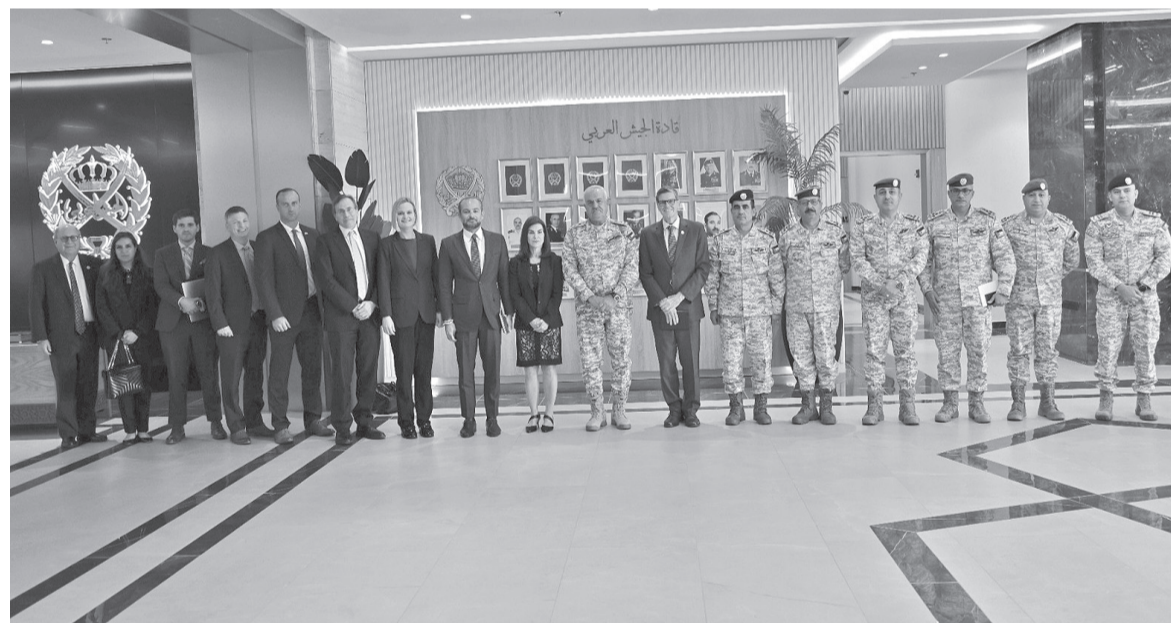
تكريس الأمن والاستقرار في المنطقة، مشيداً بمساعي وجهود جلالة الملك رؤيته في تعزيز الأمن الإقليمي. حضر اللقاء الملحق الدفاعي الأمريكي وعدد من كبار ضباط القوات المسلحة.

وأكد رئيس هيئة الأركان المشتركة، أهمية توطيد الشراكة الاستراتيجية التي تربط الجانبين، وضرورة توحيد الجهود الدولية لتحقيق الأمن والسلام الدوليين. واستمع الوفد الضيف، إلى عرض شامل حول عمليات التحديث والتطوير التي قامت بها القوات المسلحة الأردنية، في ضوء التحديات والتهديدات الحالية والمستقبلية التي تواجهها المنطقة. من جانبه عبر الوفد عن تقديره للدور المحوري الذي تلعبه المملكة بقيادة جلالة الملك عبد الله الثاني، في