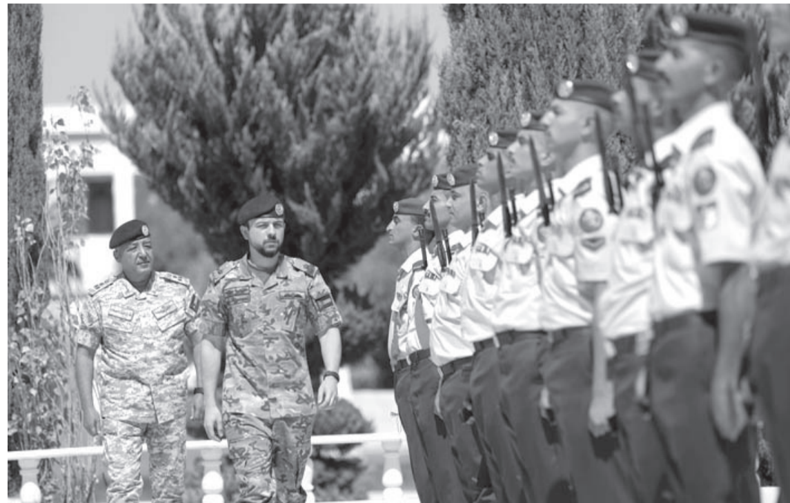
نضن البلد - عمان

تابع نائب جلالة الملك، سمو الأمير الحسين بن عبدالله الثاني ولي العهد، أمس الأربعاء،