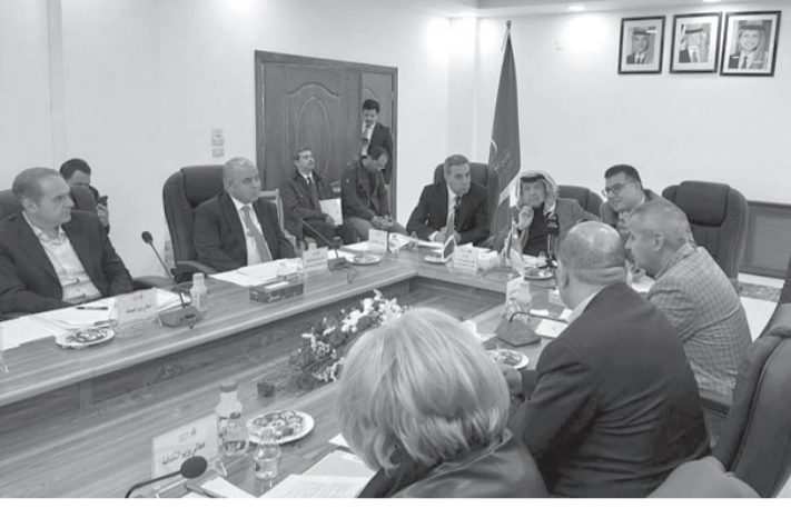
نبض البلد - جرش

عقد المشاريع التي تم تنفيذها في المحافظة (١٣٠٨) مشروعات، بكلفة تزيد على ٤٠٠,٢٧٧ مليون دينار.