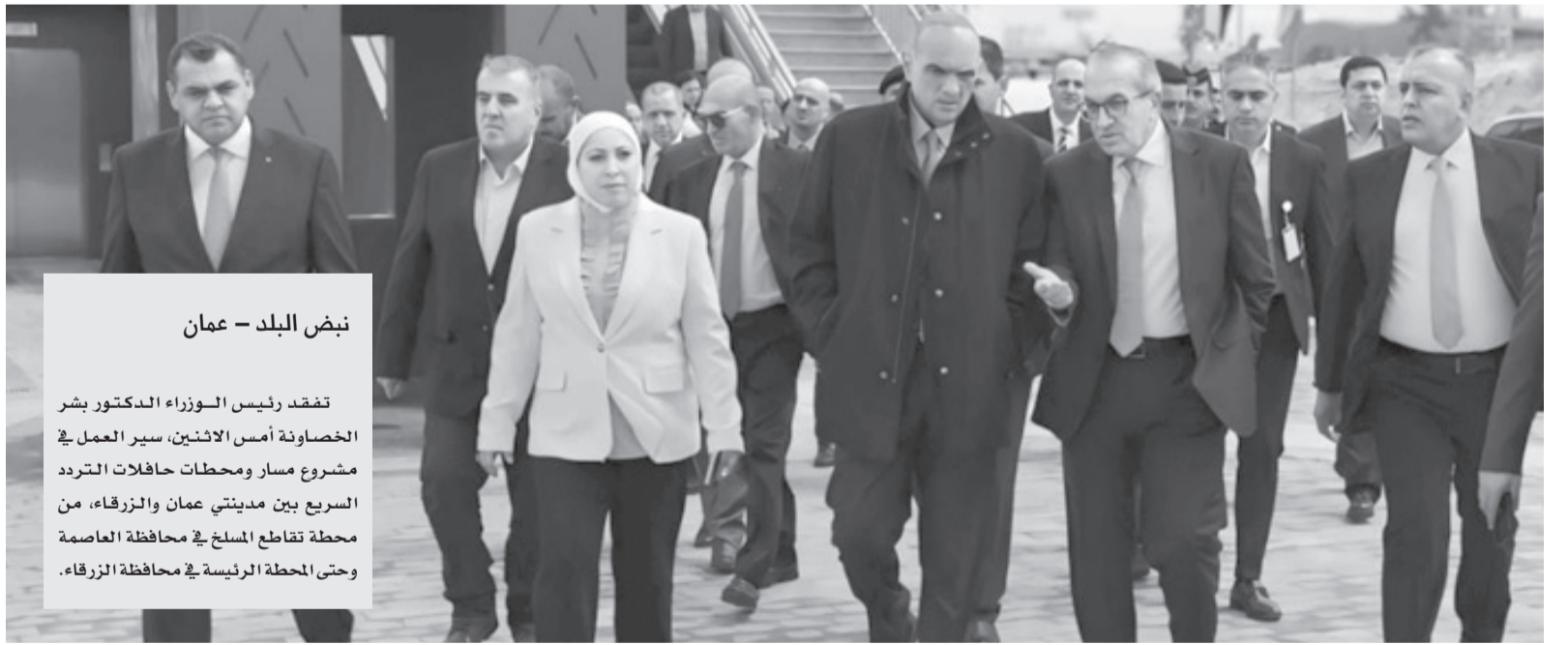
نبض البلد - عمان

تفقد رئيس الوزراء الدكتور بشر الخصاونة أمس الإثنين، سير العمل في مشروع مسار ومحطات حافلات التردد السريع بين مدينتي عمان والزرقاء، من محطة تقاطع المسلك في محافظة العاصمة وحتى المحطة الرئيسية في محافظة الزرقاء.