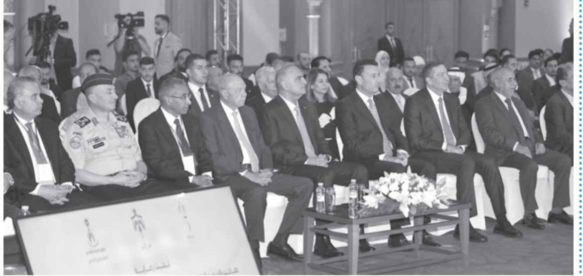
نبض البلد - البحر الميت

الملك بهي، يتطلب الوقوف إلى جانبهم للتهنؤ بدورهم، وتوسيع مشاركتهم بالحياة العامة ودعم مبادراتهم، وتذليل العقبات التي تعيق مشاركتهم الفاعلة، بمختلف الجوانب الاقتصادية والسياسية والاجتماعية، لافتاً إلى مسؤوليات الشباب، في ظل ما تواجه من تحديات أمنية واقتصادية واجتماعية، بأن يكونوا عوناً لجلالة الملك وهو يقود مسيرة الوطن بكل حكمة واقتدار، وسط هذا المحيط المتذبذب من حولنا، مواصلة الحفاظ على أمننا واستقرارنا والتغلب على تحدينا المختلفة.