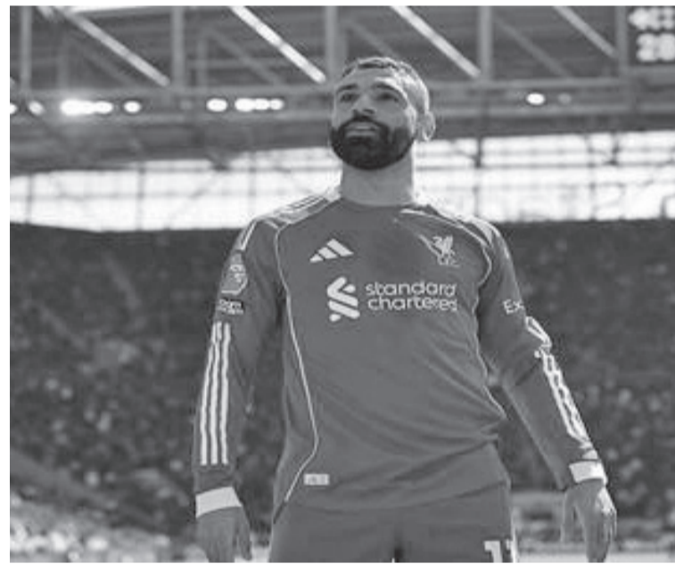
نضن البلد

الأوروبية رغم العروض المالية الضخمة القادمة من السعودية. في المقابل، لا يزال النصر في مقدمة