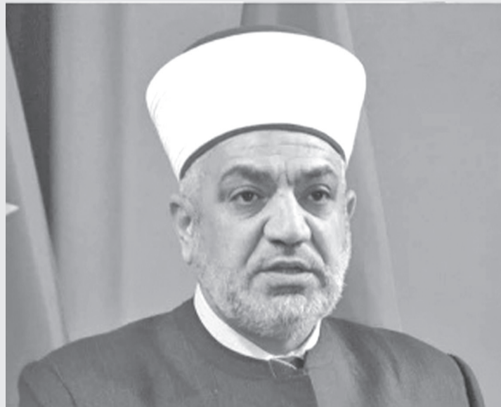
الإرشادية والطبية والإعلامية تواصل عملها على مدار الساعة لتقديم أفضل الخدمات للحجاج وتسهيل أدائهم للمناسك بكل يسر وطمأنينة، تنفيذاً لتوجيهات