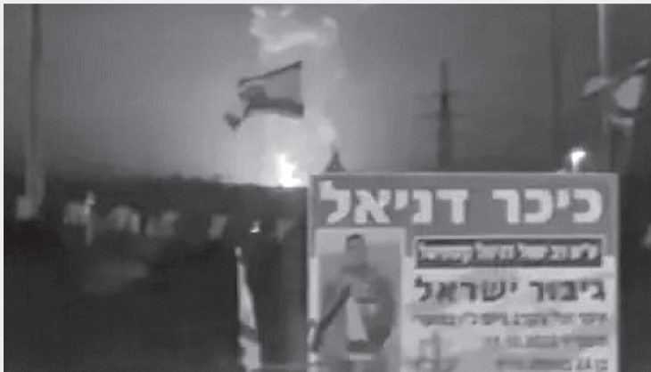
نبض البلد- وكالات

الاعتداء، واعتبر أن إصابة الأسنان سابقة للاعتقال.