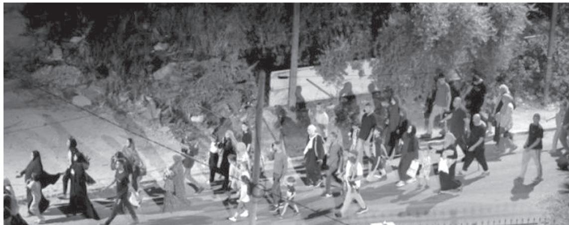
نبض البلد- وكالات

أجبرت قوات الاحتلال، منذ مطلع عام 2025، أكثر من 40 ألف لاجئ فلسطيني على النزوح القسري من مخيمات شمال الضفة.