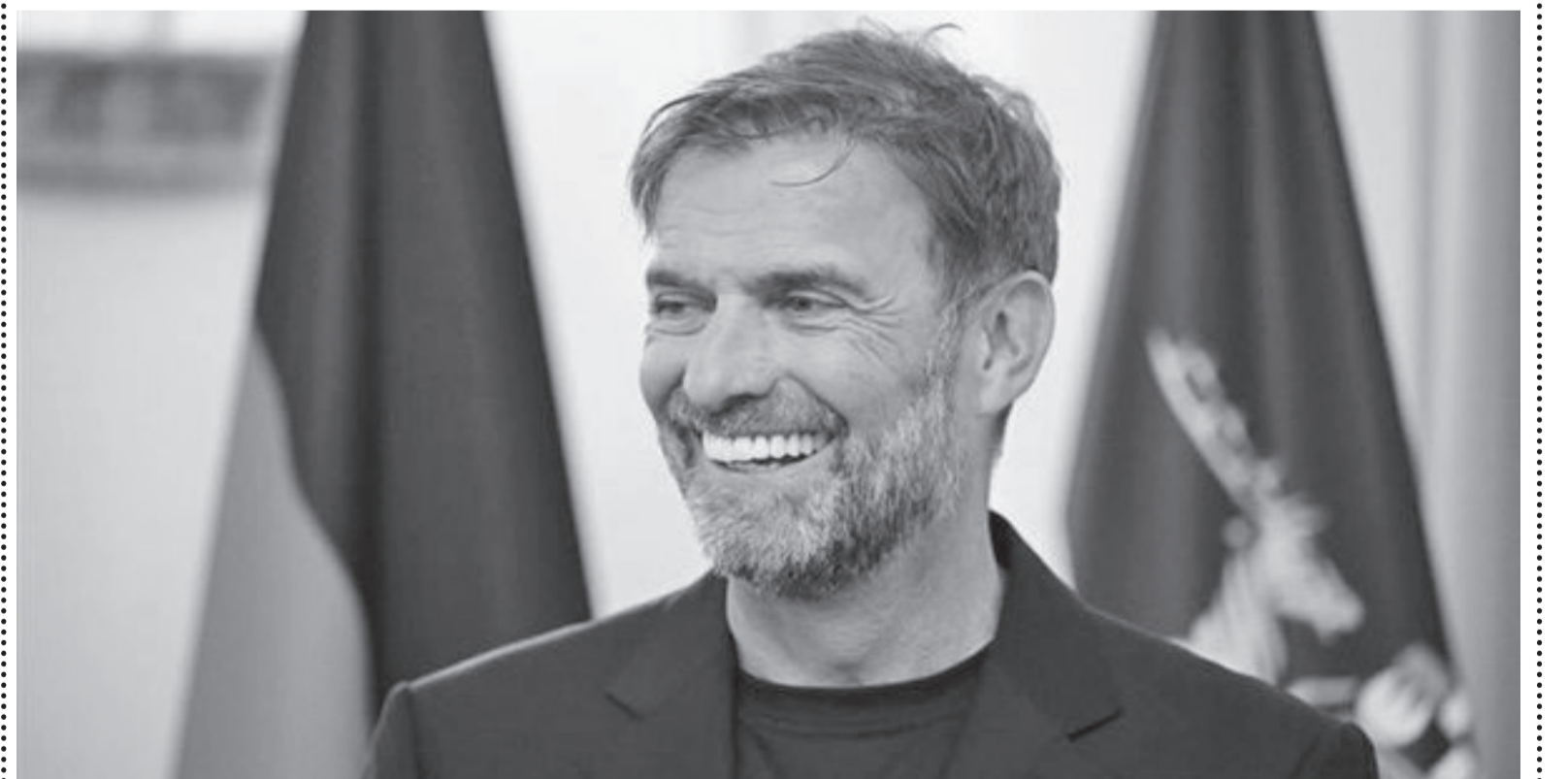
نضن البلد - وكالات

يورجن كلوب لتدريب الفريق الأول في الموسم الجديد. وكان يورجن كلوب قد سبق ورفض العروض المقدمة من ريال مدريد، لخلافة الإيطالي كارلو أنشيلوتي في بداية الموسم الحالي، قبل أن يتم التعاقد مع تشابي أونسو لتدريب الفريق، ثم تمت إقالته في شهر يناير الماضي، عقب خسارة السوبر الإسباني ونشوب العديد من الخلافات داخل غرفة الملابس، ليتولى ألفارو أربيلوا المهمة رسمياً. وأضافت الصحيفة، أن ريال مدريد قدّم «شيكاً» على بياض، للمدرب يورجن كلوب، في محاولة لإقناعه بتدريب الفريق المريدي منذ الصيف الماضي قبل بداية الموسم الحالي ٢٠٢٥-٢٠٢٦. ولكن يورجن كلوب رفض عرض ريال مدريد، وفضل العمل كمستشار رياضي في مجموعة ريد بول بعيداً عن التدريب، ومهمته هي جذب المواهب واللاعبين