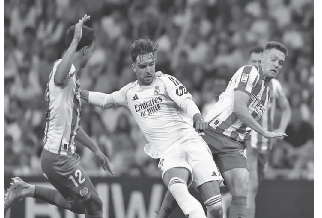
نضن البلد - وكالات

مدافع ريال مدريد راؤول أسينسيو مستشفى، في إياب ربع نهائي دوري أبطال أوروبا.