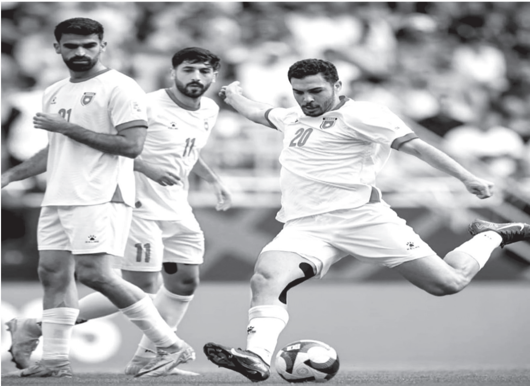
نبض البلد - عمان

ويبرز منتخب الترويج كابرز المرشحين لدور «الحصان الأسود»، محتلاً المركز التاسع بنسبة ٢٥ إلى ١، بعد تصنيفات قوية شملت الفوز على إيطاليا مرتين، بقيادة إيرلينغ هالاند ومارتن أوديجارد، في أول ظهور مونديالي للفريق منذ ١٩٩٨.