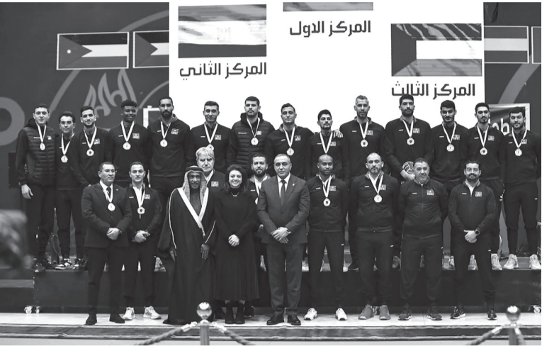
نبض البلد - عمان

توجت سمو الأميرة آية بنت فيصل، رئيسة اتحاد الكرة الطائرة، مساء الجمعة، المنتخب التونسي بطلا لبطولة كأس التحدي العربي الأولى لمنتخبات الرجال بالكرة الطائرة، والتي اختتمت في صالة الأميرة سمية بمدينة الحسين للشباب بحضور الشيخ علي بن محمد رئيس الاتحاد العربي للعبة. وحل المنتخب المصري بالمرکز الثاني، ثم جاء المنتخب الكويتي بالمرکز الثالث والمنتخب الوطني رابعا، فيما حل المنتخب البحريني بالمرکز الخامس، ثم المنتخب الفلسطيني سادسا. واختتمت منافسات البطولة أمس، بفوز منتخب مصر على الكويت بنتيجة ٣-٠، وفاز المنتخب البحريني على منتخبنا الوطني بنتيجة ٣-٢.