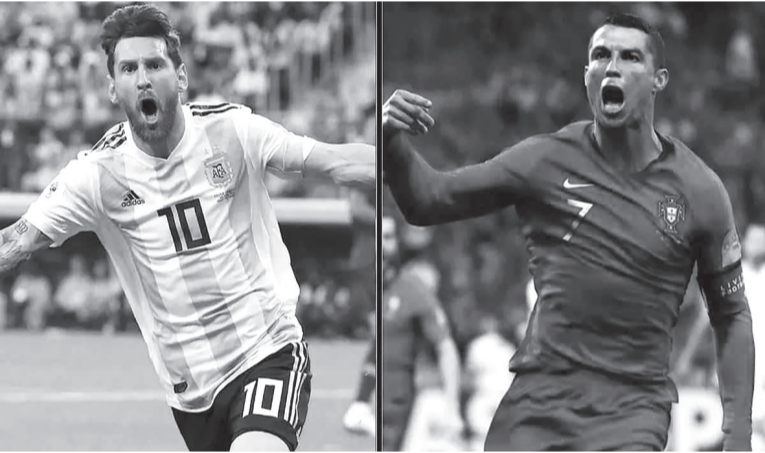
نبض البلد - وكالات

سيتمكن عشاق كرة القدم من متابعة صدام ناري بين كريستيانو رونالدو قائد البرتغال وغيريمه الأرجنتيني ليونيل ميسي في أدوار خروج الملوب بكأس العالم ٢٠٢٦. ويملك المنتخبان حظوظا كبيرة لتصدر مجموعتهم وبلوغ دور ٣٢ حيث تصطدم الأرجنتين حاملة اللقب بمنتخبات الجزائر والنمسا والأردن فيما تلعب البرتغال أمام منتخبات أوزبكستان وكولومبيا والمتأهل من الملحق العالمي (الكونغو الديمقراطية كاليديونيا الجديدة وجامايكا). ويتوقع أن يتصدر المنتخبان مجموعتهما في دوري المجموعات لتتجه الأناظار للمباراة المنتظرة والمواجهة المباشرة بين النجمين الأرجنتيني ليونيل ميسي والبرتغالي كريستيانو رونالدو.