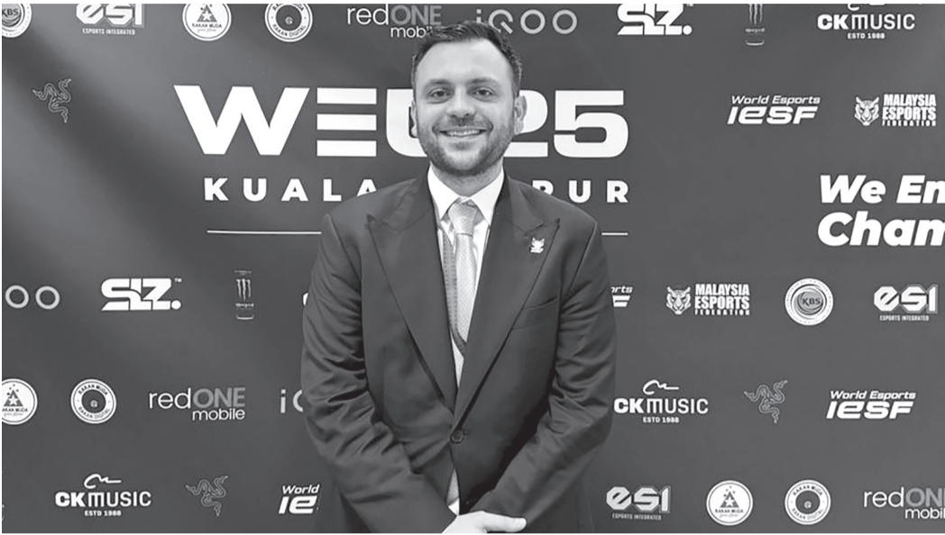
نبض البلد - عمان

فاز سمو الأمير عمر بن فيصل، رئيس الاتحاد الأردني للرياضات الإلكترونية، بعضوية مجلس إدارة الاتحاد الدولي للرياضات الإلكترونية (IESF)، وذلك خلال اجتماعات الجمعية العمومية التي عقدت السبت، في العاصمة الماليزية كوالالمبور. وحصد سموه أعلى عدد من الأصوات بواقع ٥٧ صوتا، في تأكيد على الثقة الدولية المتزايدة بجهوده ودوره القيادي في تطوير الرياضات الإلكترونية على المستويين الإقليمي والعالمي. ويأتي هذا الفوز كأول انتخاب مباشر لسموه في مجلس الإدارة، بعد أن انضم سابقا إلى المجلس بصفة عضو معين من قبل رئيس الاتحاد الدولي. يذكر أن الاتحاد الدولي للرياضات الإلكترونية، الذي تأسس عام ٢٠٠٨، يضم في عضويته ١٥٢ دولة، ويعد أبرز جهة دولية تعنى بهذا القطاع المتنامي عالميا.